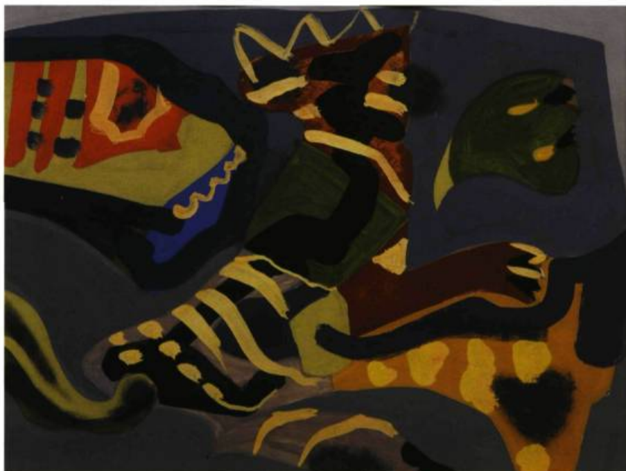
Paul-Émile Borduas Sans titre ( Un oiseau ), 1942 Gouache et fusain Exposition Refus global: 60 ans plus tard Musée des beaux-arts de Montréal Du 19 juin au 7 décembre 2008