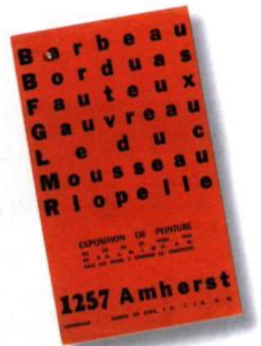
Carton d'invitation de la première exposition du groupe de peintres qu'un critique surnommait plus tard les automatistes, rue Amherst (1946).

RÉPONDENT CERTAINS JEUNES ARTISTES. AIR DU TEMPS OBLIGE, D'AUTRES PRÉFÈRENT PARLER DE « CASH ».