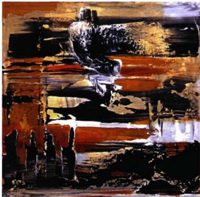
Tania Lebedeff Le Colosse de Rhodes , 2008 Huile et acrylique sur toile 30 x 30 cm

Galerie Lamoureux Ritzenhoff 68, rue Saint-Paul Ouest Montréal Tél. : 514 840-9066 www.galerielamoureuxritzenhoff.com Du 5 au 18 novembre 2008