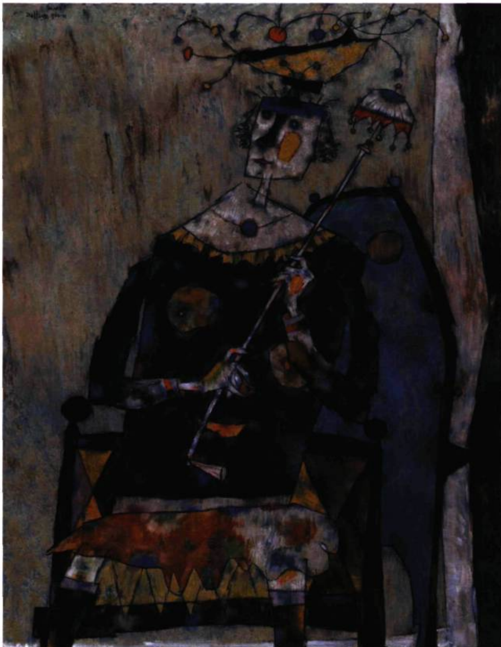
Bossue à l'ombrelle 1960-1961 Huile 116 x 69 cm