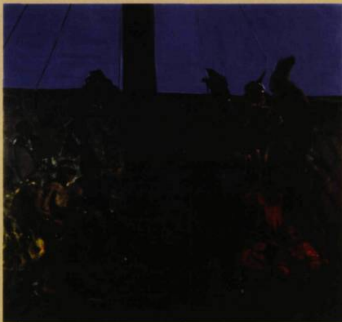
Leopold Plotek The Hazing of Charles Darwin , 2005 Huile sur toile 182 x 190 cm

En tant que peintre, il fait montre d'une gestualité infiniment souple, mais aussi de mouvements souverains, empreints de pure violence et de rupture. Il ne se réfugie pas dans les eaux lisses de la représentation ; il n'a pas embrassé la peinture à l'huile pour le simple fait de peindre sans faire de bruit. Plotek se remet constamment en question. Ses choix de sujets le prouvent amplement. La clameur délirante de la vie réelle entre dans sa peinture et la tonifie avec un rare