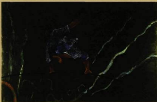
Leopold Plotek Crane, like Icarus , 2003 Huile sur toile 132 x 178 cm

et même voluptueuses. Ces tableaux sont en même temps oppressants et extatiques : oppressants comme l'effort d'une locomotive gravissant une pente, et extatiques lorsque celle-ci arrive au sommet et amorce la descente en chute libre.