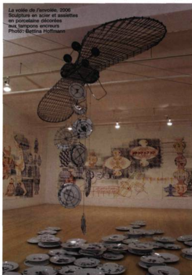
La volée de l'envolée, 2006 Sculpture en acier et assiettes en porcelaine décorées aux tampons encreurs