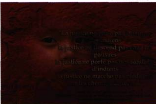
Serge Gosselin La Justice, 2005 Montage infographique et tirage au jet d'encre 91,5 X 137 cm