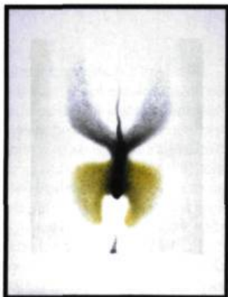
Pramod Gaikwad Know-unknown, 2006 Collagraphie 24 x 30 cm