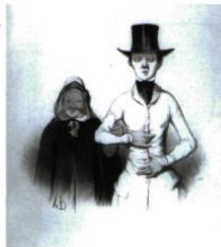
Honoré Daumier Le premier rendez-vous , 1843 Lithographie, 1 er état sur 2 20,6 x 20,3 cm Collection Freda et Irwin Browns

Ici ces estampes ne sont pas groupées par école, par chronologie, par mouvement, par foyer géographique. L'exposition fait passer le visiteur d'une estampe à l'autre d'une façon vivante tant la composition de cette collection permet des rapprochements aussi fluides. Le