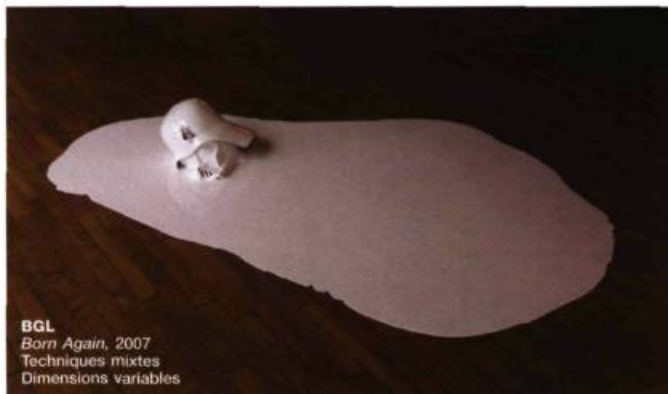
BGL Born Again, 2007 Techniques mixtes Dimensions variables

Canadian , la 5 e Biennale de Montréal donc. N'en déplaise aux artistes (et galeristes) québécois, peu