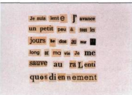
Julie Doucet Un deux trois je ne suis plus là, 2006 Collages 22,9 x 30,5 cm chacun (18 éléments)

Directeur : Claude Gosselin Commissaire général : Wayne Baerwaldt