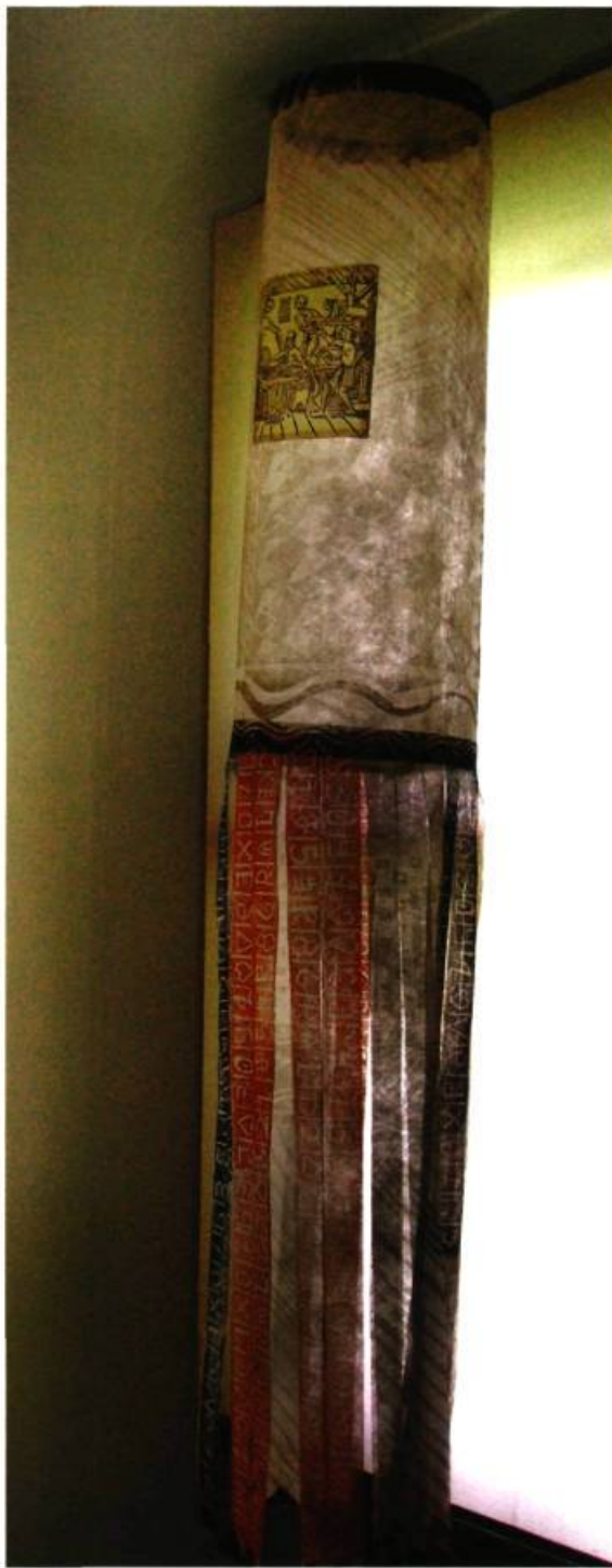
Claire Lemay Oriflamme de « La grande danse macabre », 2006 Gravure en relief sur fibre synthétique 180 x 24 cm