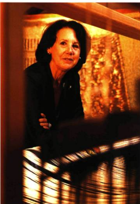
Micheline Beauchemin Récipiendaire du Prix de la gouverneure générale 2006

LA DÉTERMINATION DE CETTE FEMME A PROPULSÉ SON ŒUVRE BIEN AU-DELÀ DES POLÉMIQUES CONCERNANT LES FORMES ARTISTIQUES SUPÉRIEURES OU INFÉRIEURES 1 . L'ITINÉRAIRE ÉTONNANT DE MICHELINE BEAUCHEMIN TÉMOIGNE DE SON ESPRIT VISIONNAIRE : LONGTEMPS AVANT QUE LE PROGRAMME ACTUEL D'INTÉGRATION DES ARTS À L'ARCHITECTURE AIT ÉTÉ ÉLABORÉ, ELLE A RÉALISÉ DE NOMBREUSES COMMANDES PUBLIQUES MONUMENTALES. DANS L'ENTRETIEN QUI SUIT, CETTE ARTISTE DE LA DÉMESURE LIVRE, EN TOUTE SIMPLICITÉ, QUELQUES FRAGMENTS DE SA VASTE EXPÉRIENCE. ELLE COMMENTE LA PLACE RÉSERVÉE À L'ART DANS LA SOCIÉTÉ QUÉBÉCOISE, ELLE RACONTE QUELQUES SOUVENIRS QUI PROFILENT UN PEU SA PERSONNALITÉ ; ELLE DIT SES RÊVES ET SON AMOUR DE L'HIVER. DES PAROLES REPRODUITES DE FAÇON À RESTER FIDÈLES AU TON INTIMISTE QUI LEUR CONFÈRE LEUR TOUCHANTE ÉLOQUENCE.