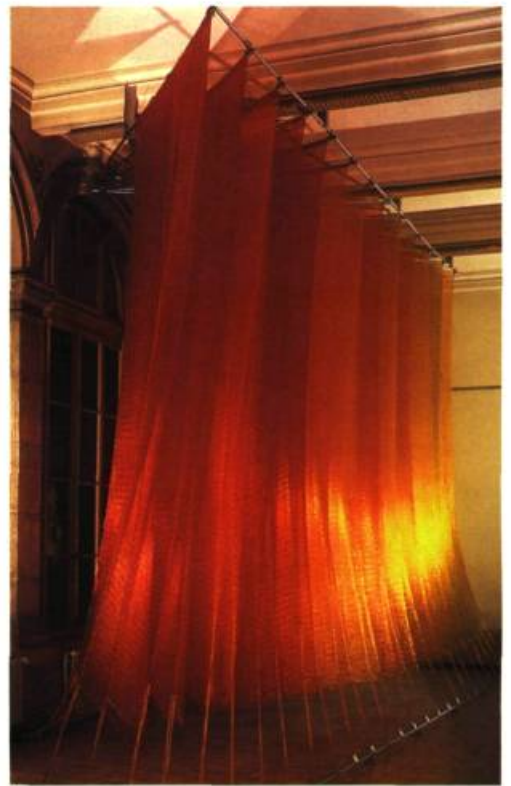
Étoile , 1981 Monofilament de nylon 15 x 7 x 3,5 m 10 e Biennale internationale de tapisserie, Lausanne, Suisse

rétrospective. Mais je sais que ce genre de manifestation coûte très cher parce qu'il faut aller chercher les œuvres un peu partout et que les musées ne disposent pas de budgets suffisants pour cela. De plus, le risque est grand de ne pas attirer des foules aussi considérables que pour des œuvres d'artistes aux noms aussi prestigieux que Miro ou Gauguin. Je trouve qu'il n'y a pas assez de reconnaissance pour notre propre culture. □