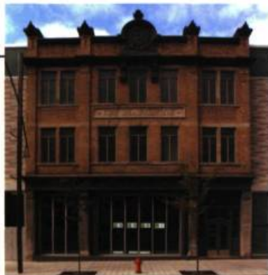
Galerie d'architecture MONOPOLI 181, rue Saint-Antoine Ouest, Montréal Tél.: (514) 238-5859