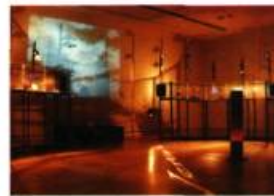
Georges Dyens, Vertigo Terrae

Le Musée du Bas-Saint-Laurent de Rivière-du-Loup vient de créer un espace permanent pour Vertigo Terrae (1994-95), une œuvre majeure de Georges Dyens, artiste montréalais de réputation internationale et professeur à l'UQAM. Le Musée du Bas-Saint-Laurent assurera désormais la diffusion exclusive de Vertigo Terrae , une installation multimédia entièrement robotisée, intégrant des hologrammes et ponctuée par une musique électro-acoustique. Pionnier et figure de proue internationale dans l'utilisation de la lumière et de l'holographie artistique, Georges Dyens exploite les infinies possibilités de ce médium depuis 1980.