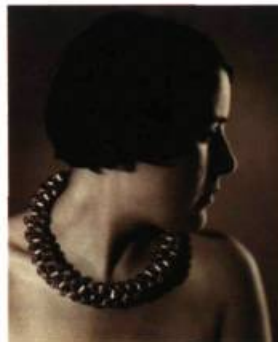
Auteur inconnu, Portrait de Dora Maar de profil, cheveux courts et gros collier , 1930.

Dora Maar, muse et artiste . Dessins et esquisses. Centre de référence et de documentation Alfred Dallaire 4231, boulevard Saint-Laurent à Montréal, du 29 juin au 29 juillet. Renseignements: 514-270-3111.