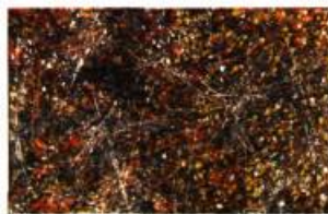
Espagne (1951), Jean-Paul Riopelle, Huile sur toile, 150 x 232 cm

La magnifique toile de Jean-Paul Riopelle, Espagne (1951), vient d'être acquise par le Musée du Québec au coût de 1 000 000 $ US à la faveur d'un montage financier réunissant en outre le ministère de la Culture et des Communications du Québec, le ministère du Patrimoine canadien, la Fondation du Musée du Québec et les Amis du Musée. Selon John R. Porter, directeur général de l'institution, il s'agit d'une des plus importantes acquisitions de l'histoire du Musée du Québec et d'un ajout majeur à la salle Riopelle. L'œuvre, rare, est considérée comme le plus ancien grand format de Riopelle connu à ce jour. Depuis sa réalisation en 1951, elle faisait partie de diverses collections particulières européennes. Les tableaux de Riopelle du début des années 50 – une période charnière dans la carrière du peintre – se font rares dans les collections publiques canadiennes. La récente acquisition du Musée du Québec amorce une correction de cette situation.