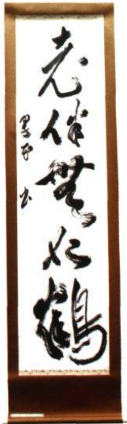
Older Games, Happiness Together

Lors de la 29 e exposition internationale de calligraphie qui a eu lieu au Musée d'art de Tokyo en février 2001, la peintre et graveuse canadienne Tobie Steinhouse a remporté la médaille d'argent pour une œuvre réalisée sur un parchemin long de 2 mètres. L'œuvre de calligraphie japonaise est inspirée d'un ancien poème chinois.