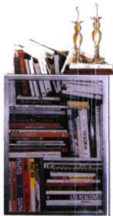
Pierre Ayot De l'impressionnisme à l'illusion, 1986 Sérigraphie photomécanique, rehauts d'acrylique et assemblage, 34/35 115 X 59 cm

L'exposition La Nature des choses propose une sélection d'une quarantaine d'œuvres de natures mortes provenant principalement des collections du Musée du Québec. Si la plupart des œuvres sélectionnées ont été créées par des artistes entre 1980 et aujourd'hui, quelques-unes toutefois, signées Ozias Leduc, Paul-Émile Borduas et Alfred Pellan, tiennent lieu de contrepoints historiques. L'exposition, réalisée par la commissaire invitée Nathalie de Blois, a été présentée au Musée du Québec pendant l'hiver 2001.