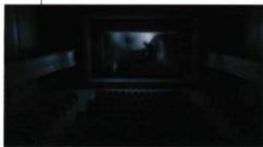
The paradise institute, 2001