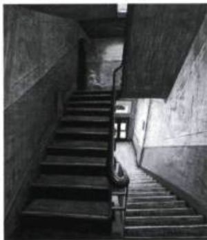
Mark Lang, Untitled , 1995 181 x 163 cm, oil on canvas.

A une époque où tant d'artistes sont attirés par la réalité virtuelle et les nouvelles technologies, les peintures réalistes de Mark Lang, un artiste vivant à Montréal, constituent presque une anomalie, n'étant ni purement formelles ni purement construites. Lang s'inspire plutôt de l'architecture urbaine délabrée du Montréal industriel à laquelle il incorpore des gens ordinaires. Comme