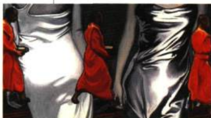
Model Walk (moines), 1999 huile sur toile, 300 x 170 cm

Montréal Télégraphe 206, rue de l'Hôpital, Vieux-Montréal Du 2 au 23 décembre 1999