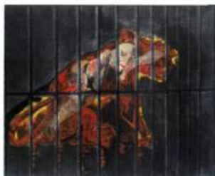
Ce qui n'est pas encore né, 1994 aquatinte

L'hybridité et la vision transculturelle qui ont fait de Clemente un leader du mouvement néo-expressionniste italien supposent simultanément une rupture avec la tradition et un emprunt à diverses traditions culturelles. L'exposition de Clemente à la Galerie Dominion comprend une série de grandes estampes étonnantes, tirées à Rome et dont les éditions varient entre 40 et 70. Ces œuvres ont un aspect rêveur, mais aussi éclectique, nomade, qui s'échappe et se retrouve. Spirituelles et sensuelles, ces œuvres font songer à celles de Fuseli et de Blake tout en ayant toujours ce sentiment bien européen qu'on n'échappe pas à l'histoire. Les couleurs vibrantes et les analogies visuelles témoignent d'un intérêt théâtral pour les thèmes éternels de la vie, de la mort et de la transcendance.