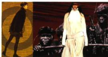
Model Walk (Zaire), 1999 huile sur toile, 333 x 180 cm