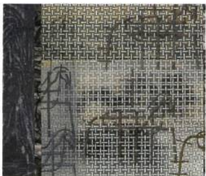
Cabine 1 , 1999, acrylique et fusain sur papier marouflé sur bois, 221,7 x 253,7 cm