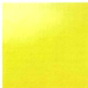
Saturation II, 1999 huile sur toile, 120 x 120 cm

Galerie États d'Art 35, rue Guénégaud, Paris Du 28 janvier au 26 février 2000