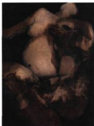
Huile II, Étude grossesse, 1996 épreuve argentique et huile, 15 x 25 cm

Maison de la culture Marie-Uguay 6052, boulevard Monk Du 27 avril au 27 mai 2000