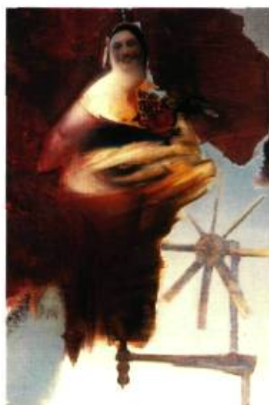
Richard Morin, Migration , 2000, huile et acrylique sur toile, 183 x 122 cm

C'est bien de charme et de fragilité dont il est question dans les tableaux de Richard Morin. Oui, ses personnages sont décidément très « charmants ». Visages parfaits, rose aux joues, petits excès de maquillage, petites boucles évanescentes plantées au sommet du crâne, les portraits respirent la santé, le bon, le bien. Et ces habits de fêtes, blancs comme neige ou ornés de grosses fleurs m'as-tu-vu! Et toutes ces petites évocations qui viennent allumer notre regard, notre ventre!... Délicieuse nostalgie, douces rêveries, voilà que nous avons le sourire aux lèvres. Ça sent chez grand-maman!