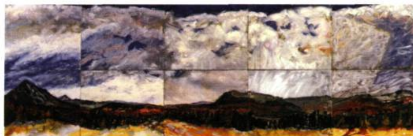
VISTAS VI: Mont Owl's Head 24 x 90 po. Huile sur panneau