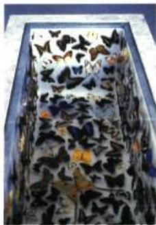
Pavane pour une infante défunte , 1997 Calcaire, papillons séchés, soie, épingles, mousse en plastique, verre 133,5 x 62 x 51,5 cm