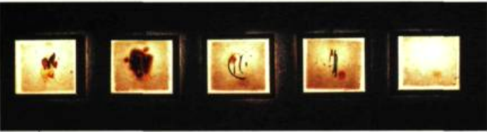
Eveline Touchette Évolution , 1999 Techniques mixtes 25 x 30 cm Chaque pièce

Quant à Éveline Touchette, avec la matière de Vie – du plâtre – elle théâtralise l'harmonie avec l'univers. Dans Évolution , l'artiste a non seulement fabriqué le papier sur lequel elle a entrepris de s'exprimer, mais elle y a aussi inséré, entre deux surfaces, des morceaux d'écaïlle d'avocat, des spécimens botaniques, bref des membranes organiques naturelles dans le corps de l'œuvre. Des configurations du cycle de la vie se donnent ainsi à voir par un jeu d'éclairage à l'intérieur de l'œuvre comme la représentation de l'intensité lumineuse nécessaire à la vie.