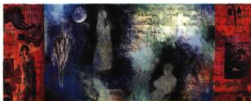
Élaine Boily Parcelles et traces de présences I, 1999 Médiums mixtes sur toiles 120 x 150 cm