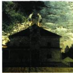
Les domiciles, 1998 Photographie Noir et blanc montée sur plaquette de bois, 20 x 10 cm

Cette façon de voir explique peut-être cet intérêt de l'artiste pour la manipulation et l'assemblage,