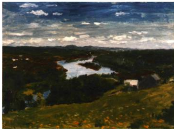
Goodridge Roberts, Lake Massachusetts Looking South , huile sur panneau, 45 X 60 cm

Goodridge Roberts est né aux îles Barbades. Formé à Montréal et à New York, il a élaboré la plus importante partie de son œuvre à Montréal. Il a acquis la notoriété qu'on lui connaît pour ses paysages, ses natures mortes et ses portraits. Nous disposons d'une sélection d'huiles sur toile et d'aquarelles parmi les plus recherchées.