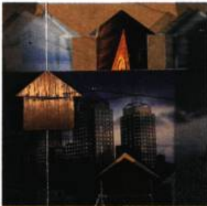
Domus, 1999 Techniques mixtes ©SODART

Danielle April demeure l'une des artistes les plus actives de la capitale. Par son engagement dans le milieu des arts - elle est actuellement présidente du Regroupement des Artistes en Arts Visuels du Québec - et par la constance et l'ampleur de sa production - plus de quinze projets d'intégrations d'œuvres d'art à l'architecture et plus d'une vingtaine d'expositions solos et collectives depuis dix ans - elle figure sans conteste parmi les incontournables de la scène artistique de Québec. Présenté en avril dernier à la galerie Estampe Plus, son dernier solo rend compte de la densité et de la diversité de son œuvre.