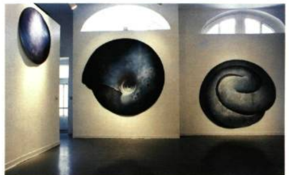
Pollens, 1999 Pastel, fusain, craie Diamètre : 200 cm (approx)