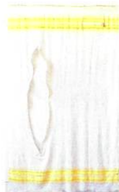
Josée St-Louis Évadée , 1999 Couverture, fermeture à glissière, cadenas 140 x 206 cm

Marie-Étienne Bessette a écrit: « Je cherche le milieu de la vie tout en tournant autour. Je crois qu'au fond ce qui est vrai c'est ce qui se tient à l'écart de mes pensées (...) en essayant de continuer à vivre pour de vrai dans le monde. » Elle énonce la musicalité de l'espace tensionnel d'un moment vécu pleinement: sous la matière picturale de Robe de nuit , la transparence du voile rose paraît flotter au-dessus de la surface et nous transporter ailleurs, quelque part dans le rêve. Puis dans la version Robe de Vie , l'utilisation du cuir brun sur des jambes de papier en mouvement colle à la deuxième peau lisible du collage, celle qui nous donne accès au mouvement réel de la perception qui s'opère d'une œuvre à l'autre.