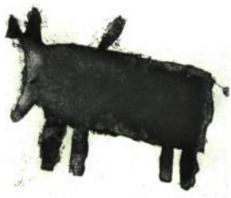
Sheojuk Aopilatunguak, 1997 Gravure rehaussée à l'encre