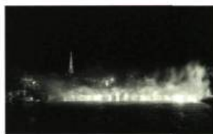
Lumière et silence

Lumière et silence , une ligne de feu signée par le sculpteur québécois André Fournelle a croisé les eaux de la Seine, à la hauteur du Pont des arts, le 20 juin dernier à la tombée de la nuit. Lors de cet événement qui s'inscrivait au programme du Printemps du Québec à Paris, deux fusées projetées de chacune des rives de la Seine traçaient un «X» lumineux dans le ciel, symbole omniprésent dans l'œuvre d'André Fournelle. Puis un rideau incandescent suspendu à trois mètres au-dessus de l'eau balisait un trajet: celui de la «ligne» de feu qui formait ainsi un paysage inattendu entre les deux rives. C'est l'historien de l'art, Pierre Restany, qui a procédé à la mise à feu.