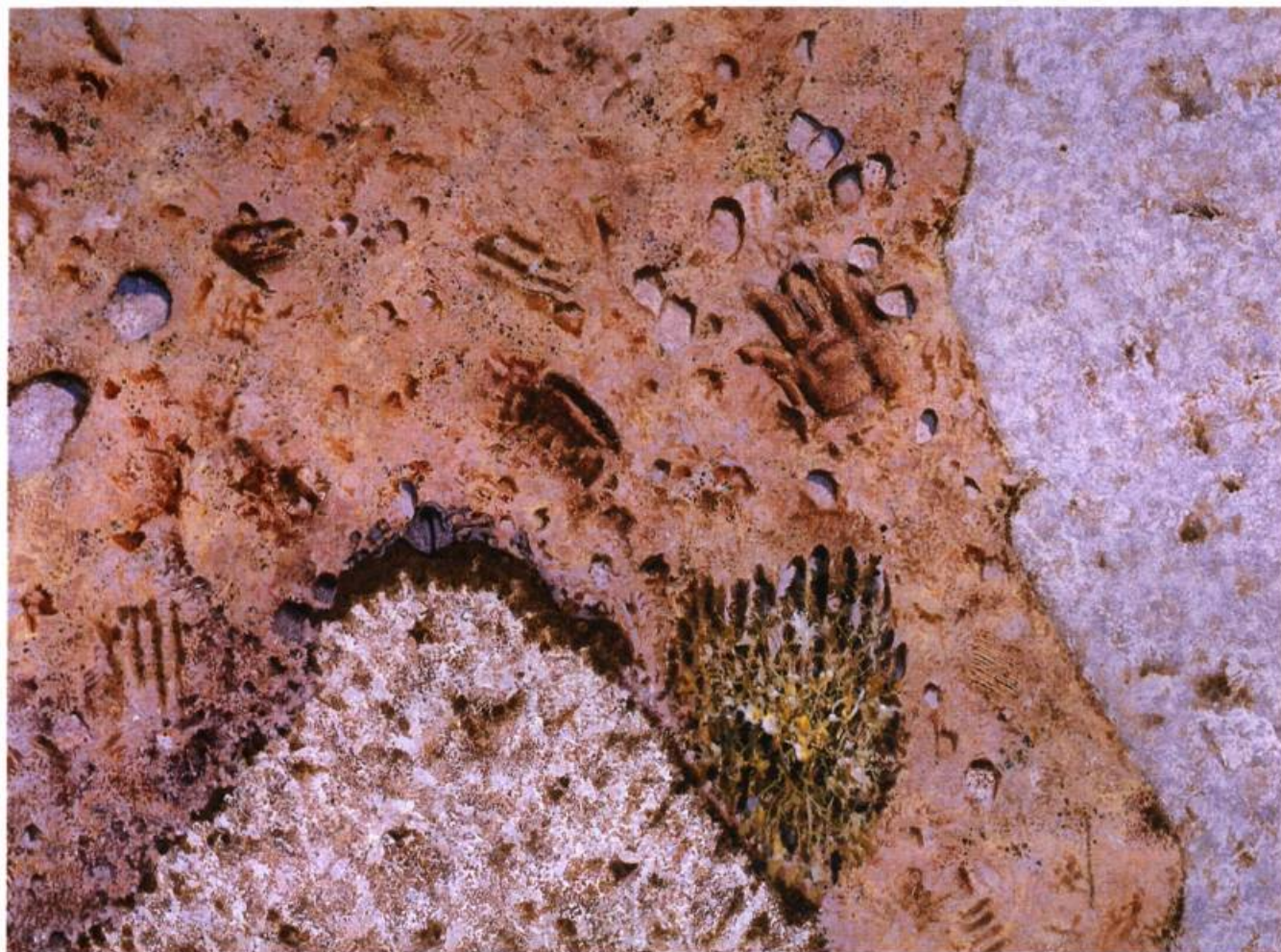
Solum II B Acrylique sur toile, 1997 130 x 97 cm

une musique, le tableau ne se hasarde-t-il pas toujours à affronter la question de ses frontières, de mes limites?