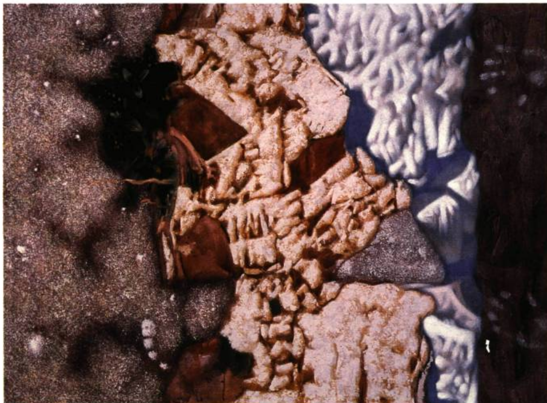
Solum IIIA Acrylique sur toile, 1997 130 x 97 cm

irrite. Ici, le dessin semble trop assuré. Le registre coloré rabat volontairement la vivacité des teintes. La surcharge des textures et des matières qui agit comme un trompe-l'œil rebute. L'iconographie flirte avec des souvenirs de la nature, comme autant de fragments épars. Bref, tout, d'un premier abord peut sembler factice et vain. Comme l'inutile de la peinture. C'est donc vrai, la peinture serait morte, à bout de souffle. Y aurait-il un espace infranchissable entre mes limites perceptuelles et émotives et les limites de cette peinture? Quelles sont donc les frontières d'un art qui est perçu comme évident et celui qui serait plus recherché, porteur d'une émotion retrouvée, d'une facture différente, d'un message nouveau? Contrairement au livre, où le bonheur de retrouver et de reprendre agit comme