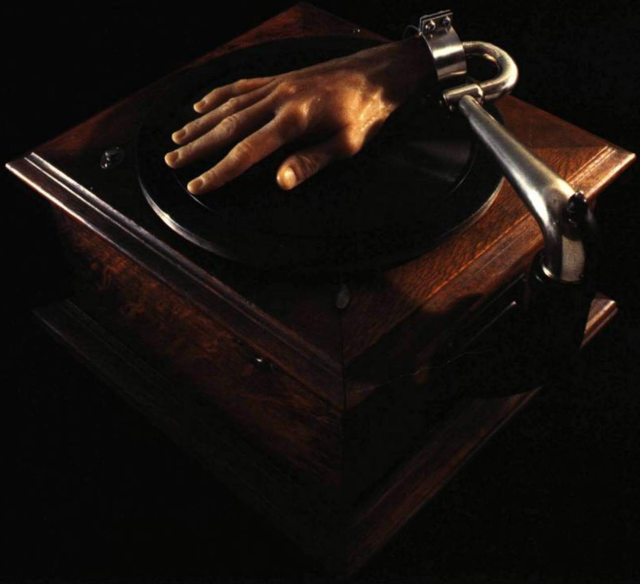
Main de cire et phonographe

T ELS DES POÈMES SURREALISTES, LES ASSEMBLAGES DE CATHERINE WIDGERY JUXTAPOSENT DES OBJETS MUSÉAUX À DES ÉLÉMENTS NATURELS