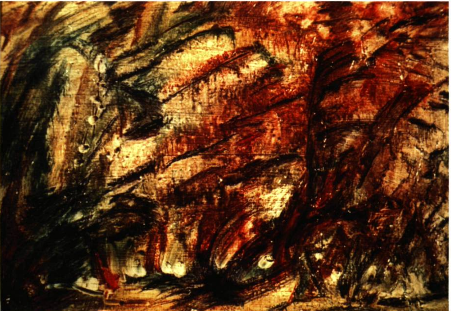
Marcelle Ferron Yba, 1947 Huile sur carton

L' ANALYSE DE QUELQUES TABLEAUX DE MARCELLE FERRON FAITE PAR PAUL-ÉMILE BORDUAS AU MOMENT DE LA PREMIÈRE RENCONTRE ENTRE LES DEUX ARTISTES EN 1946 OFFRE UNE IMAGE DE TOUT LE PARADOXE DU RAPPORT ENTRE LES FEMMES ET L'AUTOMATISME – ESTHÉTIQUE QUI, TOUT EN LES ÉLOIGNANT DES PRÉOCCUPATIONS SPÉCIFIQUEMENT « FÉMININES » QU'ELLES POUVAIENT AVOIR, A LIBÉRÉ LA CRÉATIVITÉ DES FEMMES D'UNE FAÇON SANS PRÉCÉDENT DANS L'HISTOIRE DE L'ART AU QUÉBEC.