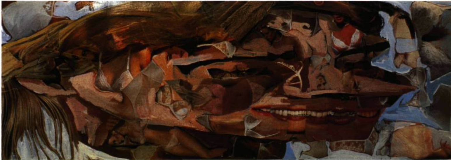
Thomas Corriveau Prénoms , 1986. Photocollage et acrylique sur toile. 30 X 78 cm.

D ÉPUIS DES SIÈCLES, LE SYSTÈME DE LA PERSPECTIVE CENTRALE OBÉIT À DES RÈGLES DE CONSTRUCTION D'UN TABLEAU REPRÉSENTANT LE MONDE SELON UN POINT DE VUE MONOCULAIRE ASSOCIÉ À CE QUE L'ON APPELLE COMMUNÉMENT, ET À TORT, LE RÉALISME. MIS AU POINT PAR LES ARTISTES DE LA RENAISSANCE ET S'APPUYANT SUR LA "RAISON MATHÉMATIQUE", IL POSSÈDE ÉGALEMENT DES PROPRIÉTÉS DÉFORMANTES QUI FURENT EXPLOITÉES PAR LES PEINTRES MANIÉRISTES ET BAROQUES ENTRAÎNANT LA PERSPECTIVE VERS DES JEUX D'ILLUSIONS DE TOUTES SORTES COMME L'AUTO PORTRAIT DE PARMIGIANINO DANS UN MIROIR SPHÉRIQUE, LES « IMAGES VEXANTES » D'ERHARD SCHÖN 1 ET LES PORTRAITS QU'ARCHIMBOLDO CONSTRUISIT À L'AIDE DE PLANTES, FRUITS, POISSONS, ETC.