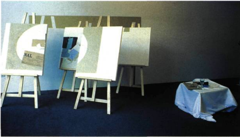
Pierre Ayot Verre et bouteille, 1985. Installation. 160 X 200 X 200 cm.