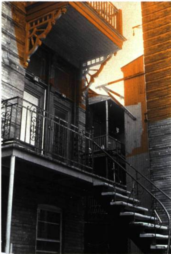
Peter Gnass Réalité-fictions, 1983. Installation, détail d'une photo.

Les ambassadeurs , l'anamorphose d'un crâne serait un anagramme d'un genre particulier qui nous renvoie également au nom de l'auteur : crâne = os creux = Holbein 2 .