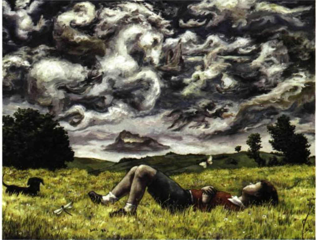
L'enfant et les nuages, 1986 Huile sur toile 73cm x 92cm

M.B. : Vous m'avez déjà dit que j'avais une mémoire visuelle et ça, je ne le crois pas du tout, pas du tout, pas du tout. Mais, seulement, ce sont les émotions, les souvenirs des sensations que j'ai éprouvées à ce moment-là, c'est ça qui est fort. Alors,