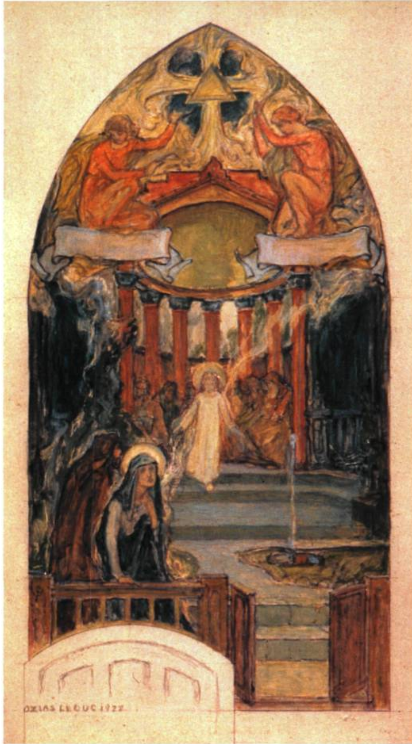
Étude pour Jésus retrouvé dans le temple , 1922 Huile, mine de plomb et crayons de couleur sur carton 43,7 x 27 cm Musée des beaux-arts du Canada