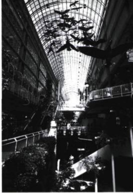
Flight Stop, 1979. Centre Eaton, Toronto.