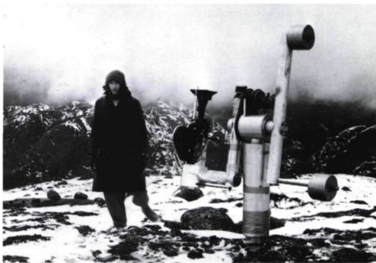
Michael Snow sur les lieux du tournage de son film La région centrale , 1970.

MS : Je crois que ça a commencé par une confusion... Et qu'elle se poursuit ... (rires). Je croyais qu'il ne fallait être qu'un musicien ou qu'un peintre à l'époque où j'étudiais aux beaux-arts. Mais il a bien fallu que je me rende à l'évidence: ce besoin de m'exprimer de multiples façons est plus fort que moi! □