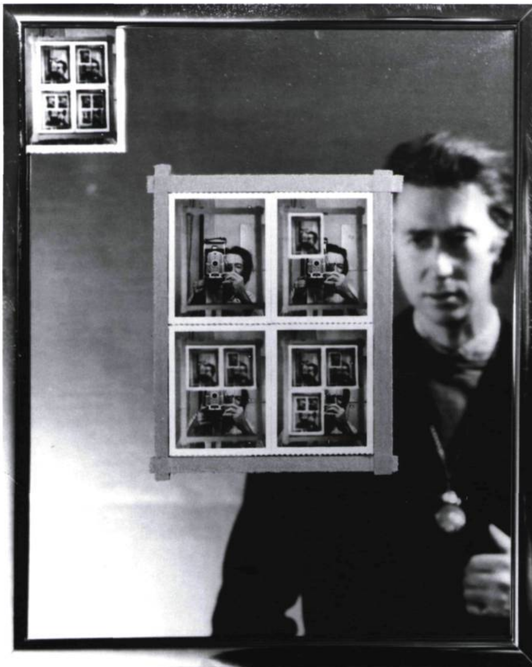
Authorization , 1969, Photographie, Musée des beaux-arts de l'Ontario.