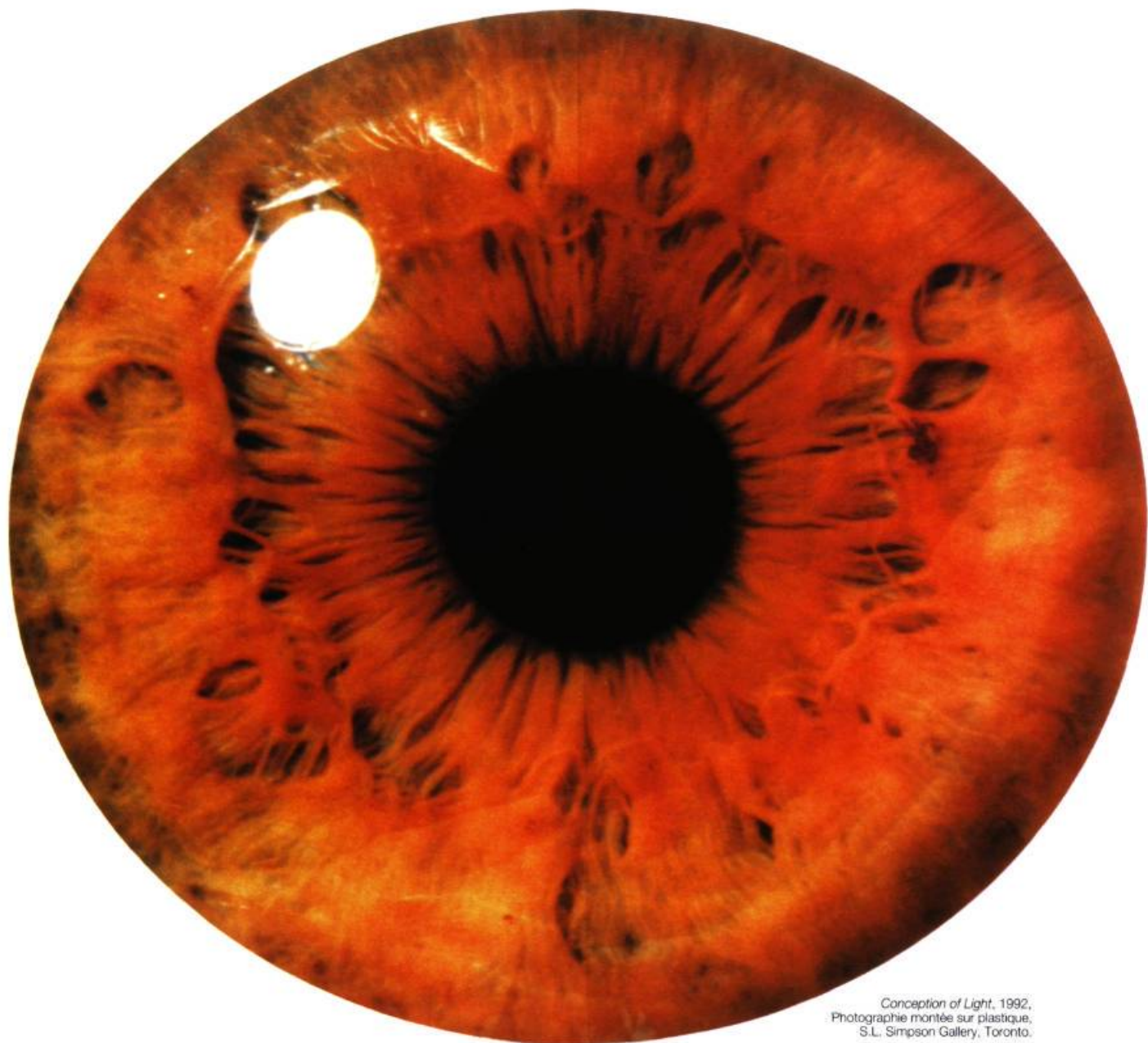
Conception of Light, 1992. Photographie montée sur plastique, S.L. Simpson Gallery, Toronto.