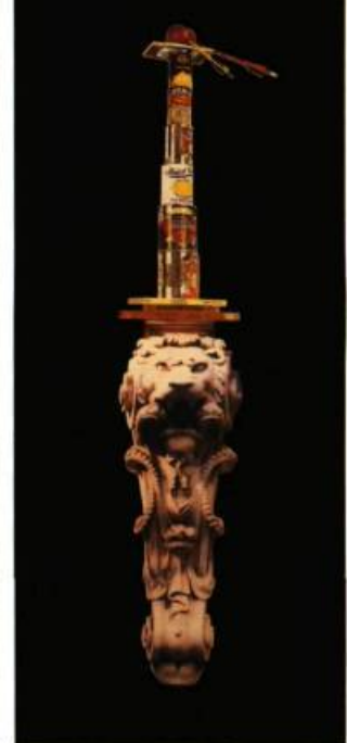
Photo de droite Duchamp tourné 1991 Techniques mixtes 158 x 30 x 10 cm