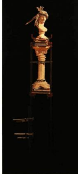
Photo de gauche Le dernier des Mohawks 1991 Techniques mixtes 200 x 35 x 10 cm

Et pour projeter sur l'oeuvre d'Ayot un éclairage plus dialectique, les textes de Rose-Marie Arbour et d'Antonio Del Quercio sont indispensables, tandis que le texte de Marc Le Bot est remarquablement pétri de culture et de finesse.