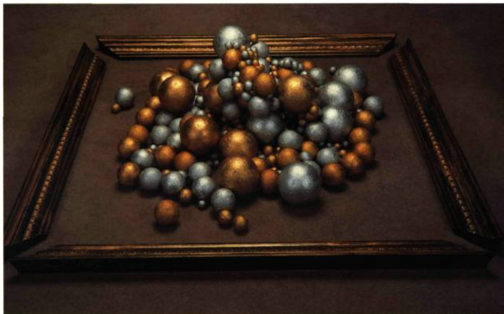
Lance Belanger, Sphères lithiques , 1991. Technique mixte. Prêt de l'artiste.