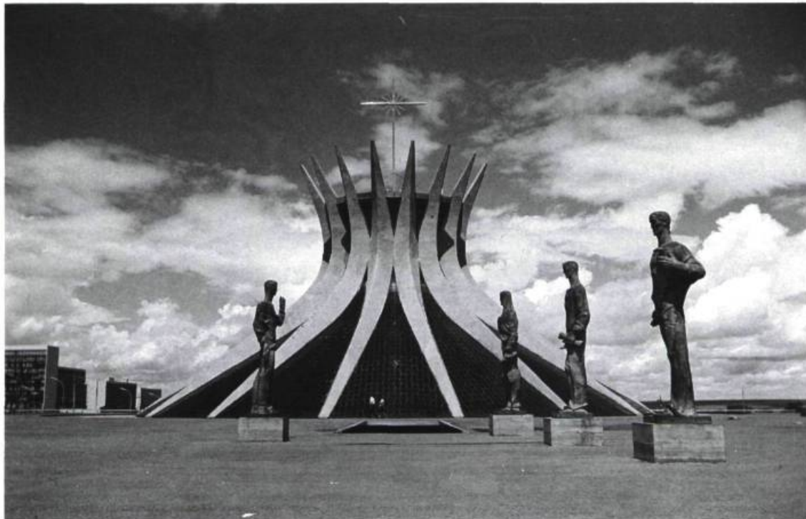
La Cathédrale de Brasilia.

- O. N.: Le gouvernement veut tenter de réduire l'occupation de la ville. Mais les gens qui vivent dans la capitale ne veulent pas partir, malgré ce que les cri-