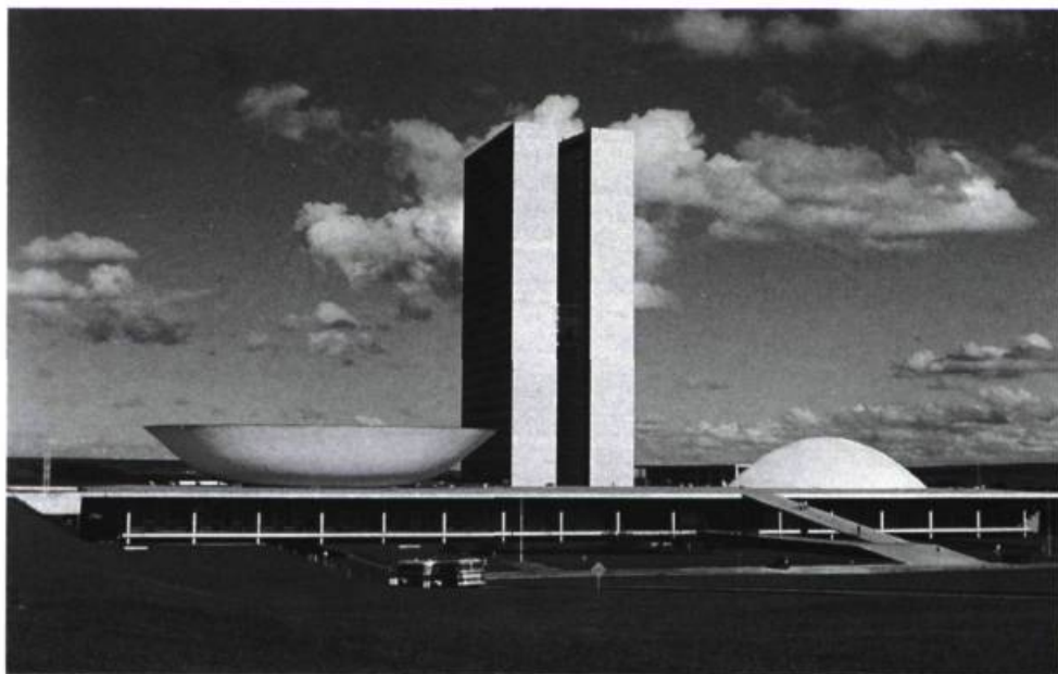
Assemblée nationale.

-O.N.: Oui. Ce qui compte, c'est de lutter contre la pauvreté, dans tous les sens du terme, être bien avec nous-mêmes, et chercher à améliorer les choses. J'ai été impliqué plusieurs fois au niveau politique, ce qui est très important pour moi; être à côté du peuple, dénoncer le militarisme, la dictature et prendre position pour être avec le peuple du Brésil. Mais je ne dissocie pas vraiment cette implication de mon travail. Je viens tout juste de terminer, à Sao Paulo, le Mémorial de l'Amérique