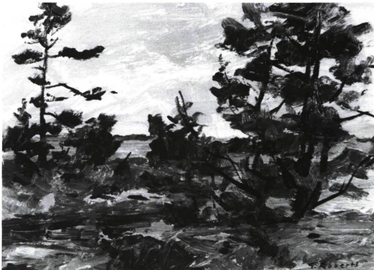
Goodridge Roberts Georgian Bay , 1962. Huile sur masonite; 30 x 40,6 cm.