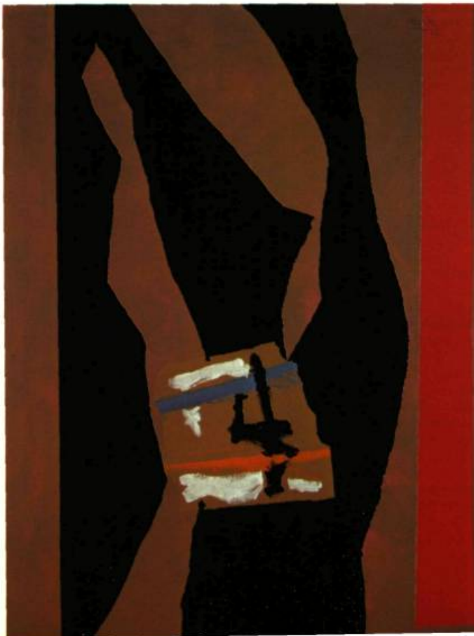
2. Odd Numbers , 1984. Collage et acrylique sur toile; 102 x 76 cm.

Vert, c'est toi que j'aime vert vert du vent et vert des branches et la barque sur la mer... Penchée à sa balustrade vert visage che- veux verts la mer est son rêve amer.