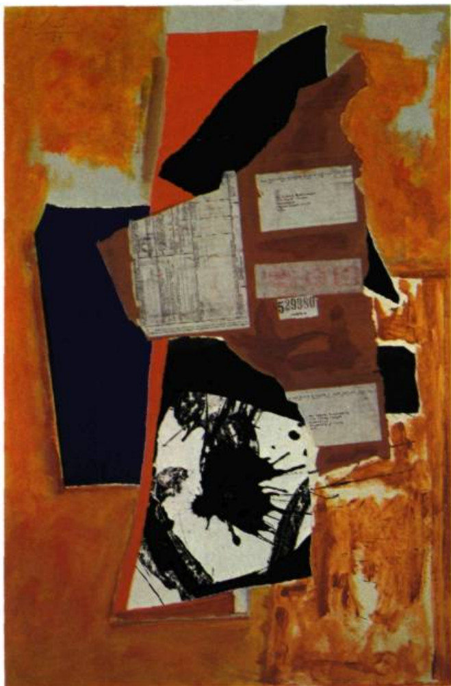
3. Royal Water Music , 1984. Collage et acrylique sur toile; 91,4 x 61 cm.

Alors qu'il vient, depuis 1942, passer l'été à Cape Cod, les couleurs de la Nouvelle-Angleterre ne lui sont pas devenues naturelles . Les Anglais sont probablement ceux qui comprennent le moins sa peinture, y cherchant le brouillard du Channel et une lumière nordique. Malgré des racines celtiques (écossaises et irlandaises) et sa grande admiration pour James Joyce, l'essence de sa personnalité et de son œuvre est liée, par analogie avec la terre californienne, à l'Espagne, au Midi, aux ocres castillans. Les Espagnols le reconnaissent dans sa peinture pour un des leurs, tout surpris de rencontrer un géant aux yeux bleus.