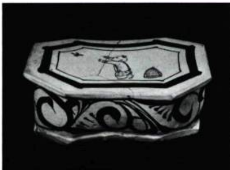
Oreiller de la Dynastie Jin, du 12 e au 13 e siècle.

ROYAL ONTARIO MUSEUM, 100, Queen's Park. Jusqu'au 30 janvier: Paul Peel, Rétrospective; Jusqu'au 11 janvier: Le Tissage à la main au Canada, au 19 e siècle; Jusqu'en février: Textiles chinois et européens des 18 e et 19 e siècles; En permanence: La Chine impériale du 5 e au 19 e siècle.