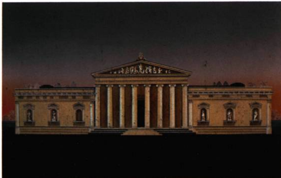
2. Inclement Weather , 1985. Acrylique, brillants, grains de plomb, letraset, sur toile; 111 cm 7 x 172,7. Toronto, Galerie Mira Godard.