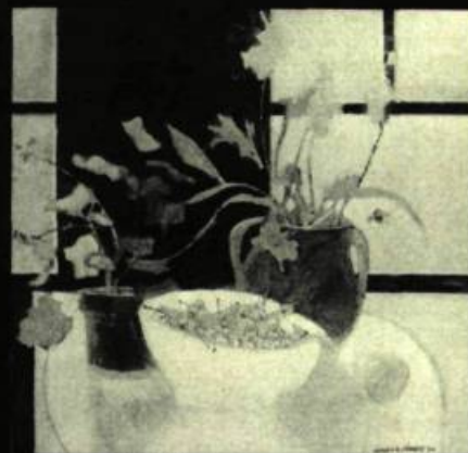
Claude-A. SIMARD Nature-morte , 1984.

2, COMPLEXE DESJARDINS, BUREAU 2600 C.P. 153, MONTRÉAL, H5B 1E8 TÉL.: (514) 281-1555 TÉLEX: 055-60917