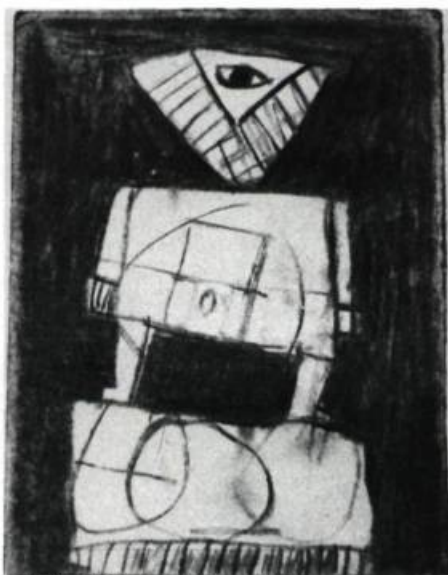
2. Vigile, 1982. Fusain sur papier.