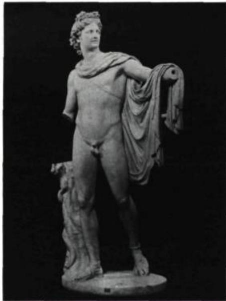
Les Collections du Vatican APOLLON

THE ART INSTITUTE, Avenue Michigan et rue Adams. Jusqu'au 16 octobre: Les Collections du Vatican – La Papauté et l'art; Du 12 octobre au 3 janvier: Alfred Stieglitz; A partir du 19 novembre: Aqua Lapis – Sculptures murales brodées, 1977-1983; A partir du 10 décembre: Les Allemands en Pennsylvanie.