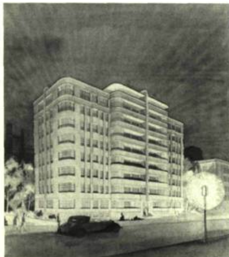
Architecture monumentale McCARTER et NAIRNE, architectes

Du 13 septembre au 30 octobre: Un chant muet - John Paskievich, Photographies du monde slave; Du 8 novembre au 4 décembre: Dorothy Knowles, Rétrospective; Du 8 décembre au 5 janvier: L'Art oublié de l'architecture ornementale.