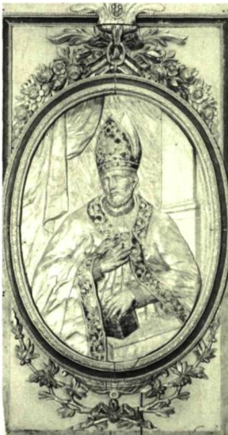
Collection du Musée François et Thomas BAILLAIRGÉ

Jusqu'au 9 octobre: Les Saisons dans l'art québécois; Jusqu'au 16 octobre: Un panorama de la collection; Du 21 septembre au 26 octobre: Accents américains; Jusqu'au 31 octobre: Orfèverie.