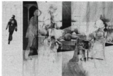
6. Hélène LANOIE Tourmente , 1981. Eau-forte; 55 cm 8 x 76,2.

L'automne dernier 1 , Noctuelle réunissait cinq graveurs et quatre sculpteurs de la Mauricie 2 . On connaissait un peu les graveurs, qui sont regroupés autour de l'Atelier Presse Papier, depuis leur exposition à la Galerie A, à la fin de 1981. Cette fois-ci, on présentait assez d'estampes de chaque artiste pour que le visiteur puisse entrevoir des univers personnels, et cela confirmait le sérieux et la cohérence de cette petite colonie de graveurs qui paraissent, pour le moment, préoccupés d'asseoir leur pratique sur une solide tradition. Cette attitude est aussi celle des sculpteurs mais, la discipline de la sculpture ayant évolué à un autre rythme que l'estampe volontiers traditionnelle, leurs propositions, trop bien élevées , faisaient entendre des sonorités certes agréables mais archiconnues. Dans ce