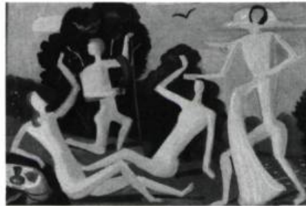
18. André DERAÏN Nymphes , v. 1949. Huile sur toile; 25 cm 4 x 36,8. New-York, Theo Waddington & Co., Inc.