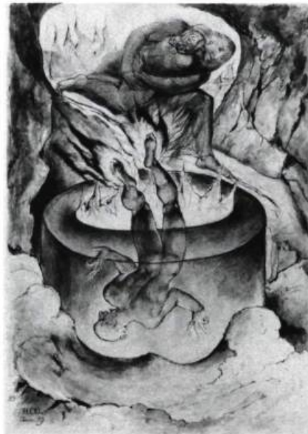
17. William BLAKE Le Pape simonique de la Divine Comédie de Dante, 1824-1827. Aquarelle et crayon sur papier; 52 cm 7 x 36,8. Londres, Musée Tate.

Les grandes expositions, comme celle qui eut lieu au Musée Tate, en 1978, sont fort rares.