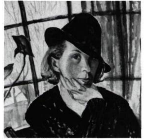
16. Paraskeva CLARK Autoportrait , 1937. Aquarelle sur papier; 53 cm 3 x 50,8.

Sujet d'un court métrage récent, Portrait of the Artist as an Old Lady , Paraskeva Clark qui, par son franc-parler et son esprit piquant, est très intéressante, voit la vie de la femme peintre sous un jour réaliste. «Comment une femme pourrait-elle devenir une grande artiste, a-t-elle demandé à un journaliste d'Ottawa, quand elle est toujours rendue dans les magasins Loblaw