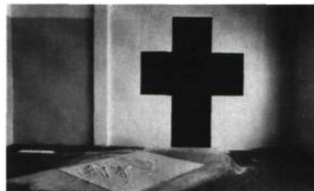
10. Irene WHITTOME Room 901, 1982.

tés à la gamme des noirs et des blancs, en passant par les gris, de constructions de plans, de volumes (parallélogrammes verticaux), un prolongement de l'illusion se manifeste. Indépendamment du cadrage photographique, une colonne noire est installée, un bout de plancher est mis en évidence, un plan gris vient bloquer la logique de la construction architecturale de l'atelier. C'est à la perception de ces interventions de l'artiste que le tableau devient inquiétant. À la lecture des photos comme point de départ, le tableau était apparu dans sa capacité à signifier le vide, i.e., première manifestation de l'inquiétude et, dans un deuxième