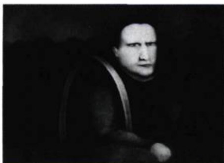
3. Georges BRU Personnage au baudrier . Crayon et lavis sur papier; 71 cm x 100.

Dans une suite sans titre de sketches d'une précision chirurgicale, Anne-Marie Soulié ajoute à l'emploi de la couleur la violence du sujet: le corps ligaturé, relié, branché, perfusionné, incisé, avec, récurrente, l'inquiétante obsession de voir le tube salvateur tranché, déconnecté. Le corps humain, plus ou moins