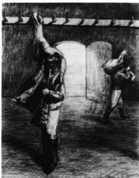
5. Gérard BERINGER Autoportrait . Mine de plomb sur papier; 65 cm x 50.