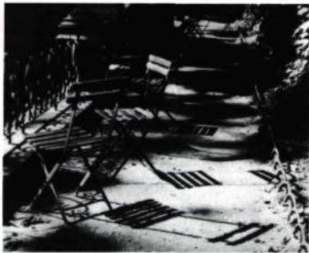
2. André KERTÉSZ Chaises , Paris, 1925.

l'événement y devient le quotidien prosaïque, et la famille y est élargie au genre humain conçu comme espèce, une espèce dont il photographie inlassablement la proximité, la distance, l'ombre et même l'absence. Dans une démarche qui mêle étroitement l'obstination scientifique de l'ethnologue et la décontraction du joueur qui courtise la chance, Kertész va fixer, matérialiser, le spirituel, l'indicible, sur la pellicule: il va créer des archétypes photographiques des sentiments et des comportements de ses contemporains. A ce titre, le bel ouvrage édité à l'occasion de la rétrospective fait figure de petite encyclopédie du quotidien. On y voit l'humain tour à tour coquet et négligé, bavard et taciturne, tendre et affairé. L'imagination et l'humour qui coulent librement dans ces pages font un véritable bestiaire de ce qui aurait pu facilement verser dans le documentaire. A preuve tous ces objets au travers desquels Kertész traque l'esprit, la marque de l'humain ( Chez Mondrian , Paris, 1926), avec cet