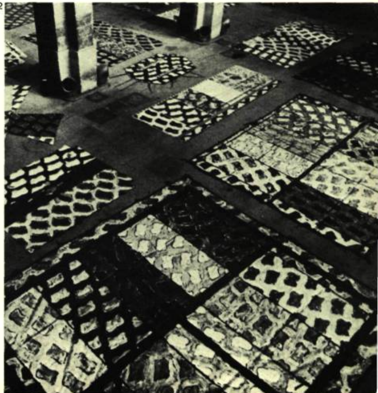
2. Autres travaux de 1979 de Viallat.

Texte publié dans le catalogue CLAUDE VIALLAT-TRACES, Musée de Chambéry, 1978.