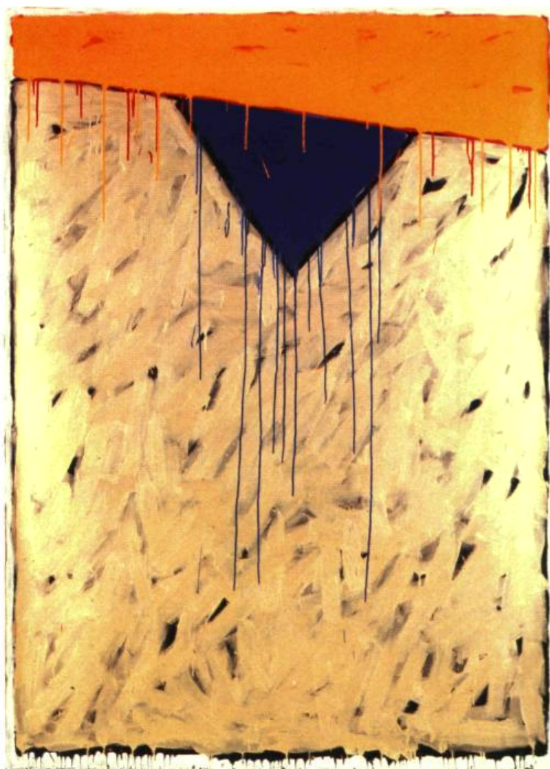
3. Triangle bleu, 1981. Acrylique sur toile; 2 m 13 x 1.52.