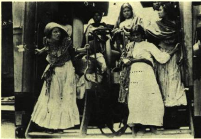
4. Photogramme tiré du film de Sergei Eisenstein Que Viva Mexico.