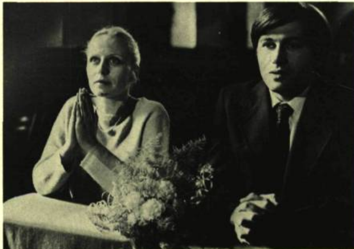
1. L'Homme de fer d'Andrzej Wajda, présenté au Festival de Cannes, 1981.

Éreinté par les critiques américains lors de visionnements précédents, puis remanié et raccourci, Porte de ciel de M. Cimino