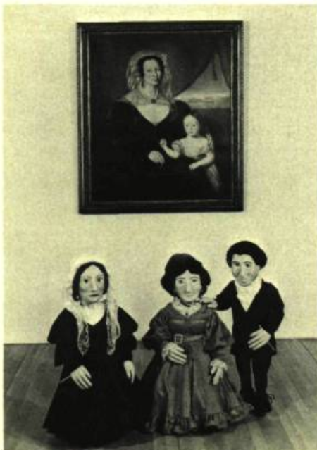
6. Travail d'atelier pour les marionnettes.