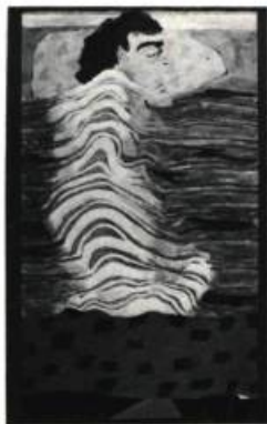
3. Louise ROBERT N° 392 (Muet). Acrylique et huile; 77 cm x 59.