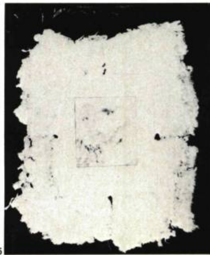
5. Paul LUSSIER L'Apocalypse du préau d'Henri. Papier; 66 cm x 54.