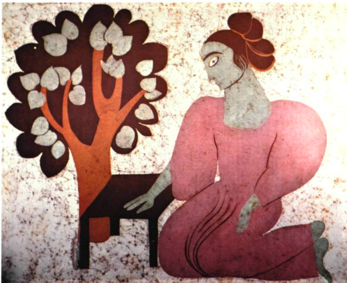
2. Süzel BACK Abaco. Batik; 147 cm 3 x 101,6.

Rires dans du soleil, Ivoire, agenouillements timides, les mains aux choses de la terre . . . Vendredi! que la feuille était verte et ton ombre nouvelle, les mains si longues vers la terre, quand, près de l'homme taciturne, tu remuais sous la lumière le ruisselle- ment bleu de tes membres! (SAINT-JOHN PERSE, Images à Crusôé — Vendredi. )