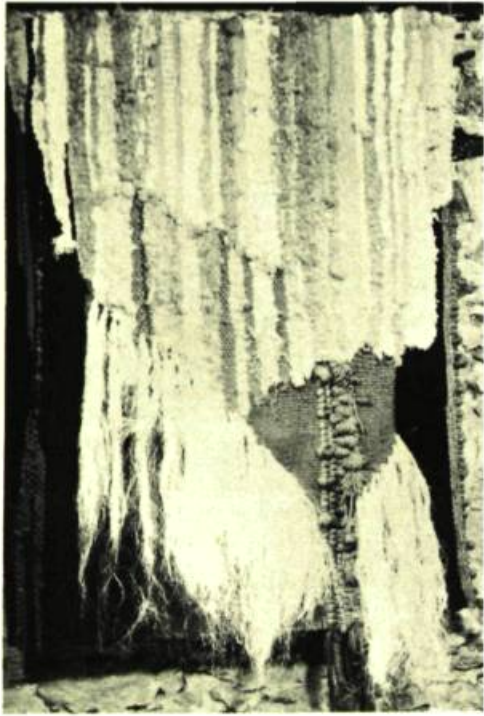
1. Yolande DUPUIS-LEBLANC Sans titre , 1974. Tapisserie laine et chanvre; 152 cm. x 122. Collection privée.