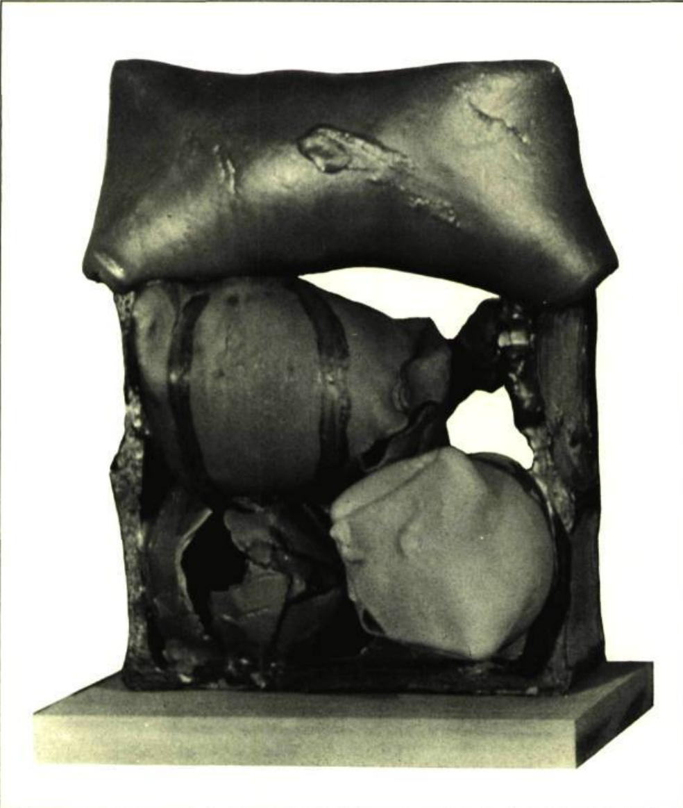
3. Michel SAVOIE Sans titre , 1974. Sculpture céramique; 43 cm x 33 x 25.

persistent dans une certaine ségrégation de la part de ceux qui se disent avant tout des créateurs envers les professeurs qui, tout en assumant leur rôle d'enseignant, réussissent à réaliser une production continue. Or, ces artistes de la génération des 30-40 ans sont tous des praticiens qui, après leur apprentissage à l'École des Beaux-Arts de Montréal, ont enseigné dans des écoles primaires ou secondaires. Ils enseignent maintenant, à l'Université du Québec à Montréal — à plein temps ou comme chargé de cours, et, malgré leur tâche de professeur, ils produisent des œuvres personnelles de qualité.