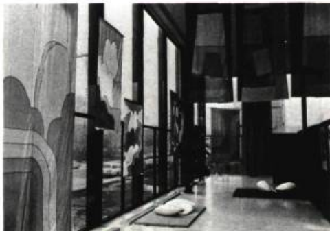
Les sculptures en matière plastique d'Hannah FRANKLIN complètent l'exposition des Canada Banners.