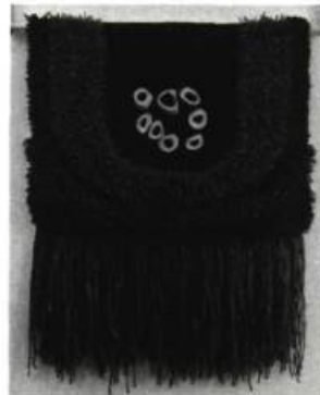
CARREAU-KINGWELL Lave volcanique , 1973. Tapisserie de laine et os; 28 po. x 36 (71.1 x 91.4 cm.). Montréal, Galerie L'Art Français.

Jean CRITON «... l'incroyable qu'on ne voit pas». Paris, L'Oeil de Boeuf.