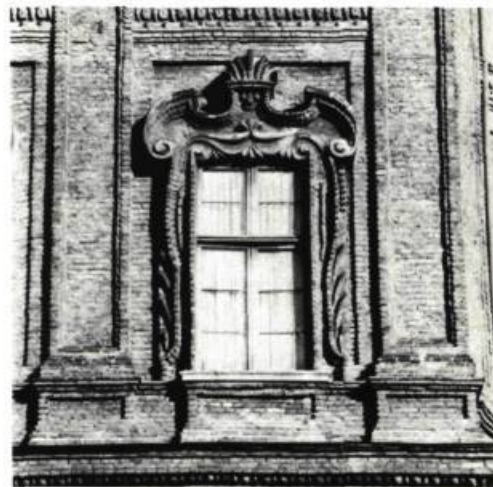
1. Vue aérienne du palais Carignan, Turin. La moitié postérieure date du XI e siècle.

On peut seulement imaginer, conclut Mlle Lange, combien le prince de Carignan, que l'infirmité écartait de la vie active, a apprécié l'hommage et le souvenir des campagnes de son régiment; et comment aussi les aventures cana-