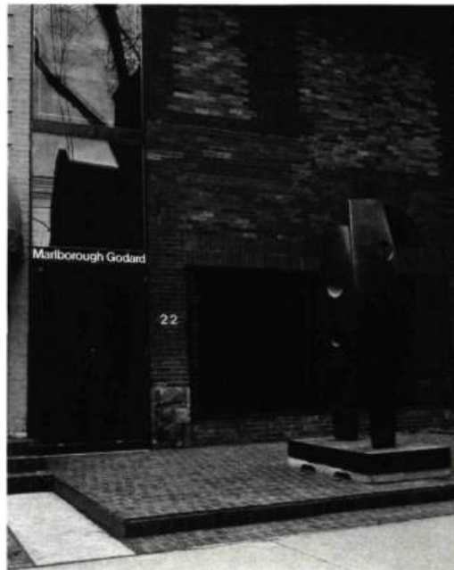
Un avant-goût rassurant: les figures de bronze de Barbara HEPWORTH.