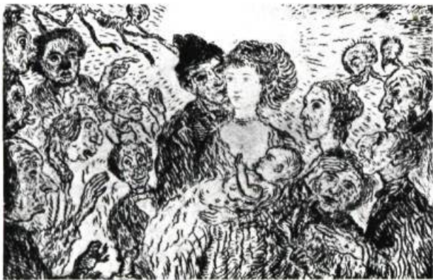
L'Envie, 1904. Eau-forte; 3-7/16 po. x 5 7/8 (9.8 x 15 cm.).