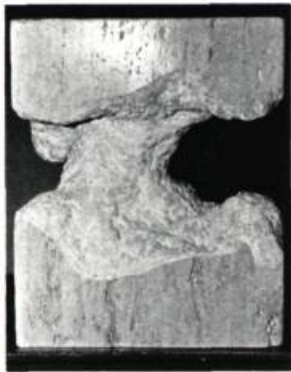
Daniel ROY Coeur de pierre , 1973. Travertin; 12 po. x 15 x 8 (30.4 x 38.1 x 20.3 cm.). (Phot. Marika Bondeau)

Parallèlement à ce jeu esthétique, on utilise quelquefois l'alliance de matériaux: Picard dans Accouplement (cuivre, bronze et pierre), Jean-Yves Côté avec Saint Sébastien (marbre blanc et bronze) où existe un système de lignes et d'équerre. Mais, chaque fois, on se préoccupe de sculpter des formes abstraites qui en viennent pourtant à revêtir des apparences visibles dans le réel. Nous avons là, alors, des pièces qui se situent à la limite de ce qui est identifiable ou non.