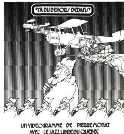
UN VIDEODRAMME DE PIERRE MONAT AVEC LE JAZZ LIBRE DU QUÉBEC