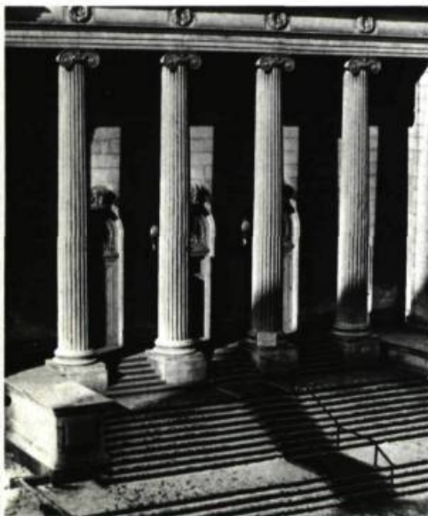
L'entrée du Musée.