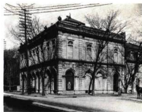
L'Art Association (1879-1912), à l'angle de la rue Sainte-Catherine et du côté est du Square Phillips.

Longtemps, le Musée des Beaux-Arts a vecu grâce à la générosité des