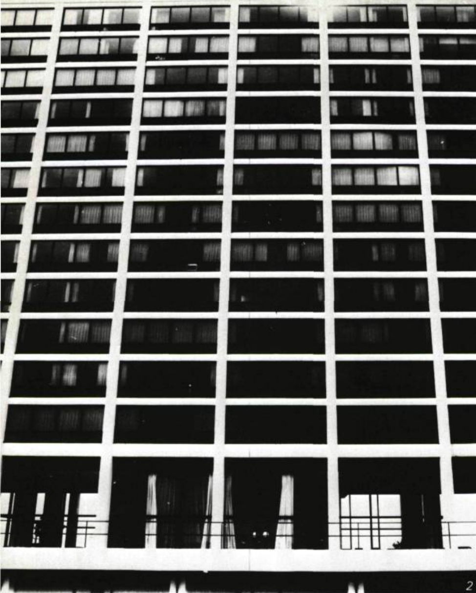
1. L'opposition du béton blanchi et des parties métalliques noires. En bas, l'escalier menant à la piscine annexée à l'immeuble numéro 1. En haut, le rez-de-chaussée du même immeuble. 2. L'immeuble numéro 1. Vue détaillée de la face arrière. 3. L'immeuble numéro 1. Vue générale.