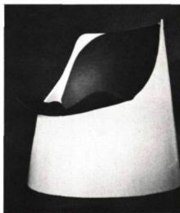
Ce fauteuil de carton est démontable et empilable. Conception simple : deux morceaux de cylindre s'emboîtent à l'intérieur d'un cône tronçonné. Conçu par Michel Germain.