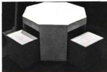
Table et quatre tabourets.