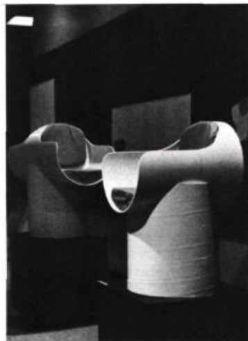
Fauteuils légers, extrêmement résistants dû à l'épaisseur déjà formée du carton. Conçu à partir d'un cylindre de carton par André Asselin.