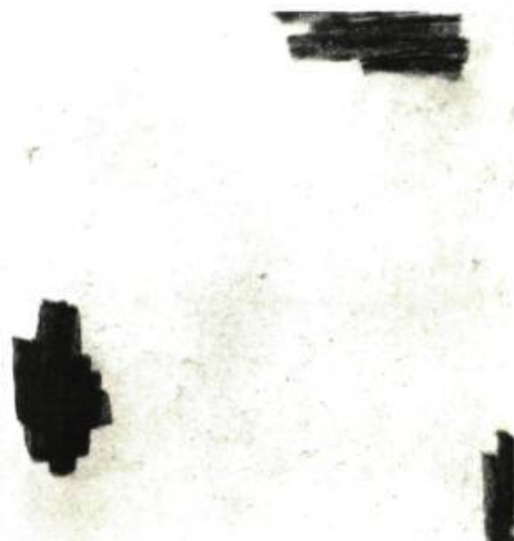
Encre. 1923. Collection Hans Hartung.