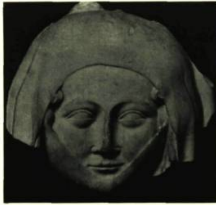
Masque funéraire. Marbre. XIVe siècle. (Donné par le Louvre). Arras, Musée.

Alors que Barcelone avait été choisie pour évoquer l'art roman, Paris l'a été parce que, en Ile-de-France, le Domaine royal fut le lieu d'élection des expériences les plus librement tentées, où le style de l'ogive s'est élaboré. La croisée d'ogive a ensuite envahi le monde, s'imposant plus lentement dans les pays où la voûte romane affirmait ses formes. L'art ogival a subi maintes métamorphoses suivant le terroir où il s'est implanté et l'Exposition du Printemps 1968 de Paris les montrera. Le Pavillon de Flore permettra de confronter des sculptures françaises de Mantes, de Reims, de Bourges avec des reliefs suédois d'Upsal où la technique des ateliers d'Ile-de-France est visible. Des peintures sur bois, des morceaux de fresque d'Oragna, venant de S. Maria Novella de Florence, évoquent cette peinture austère si différente de