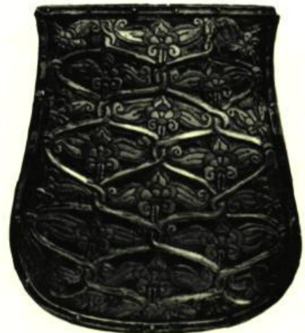
Plaque recouvrant une bourse. Argent ciselé de l'époque magyare.