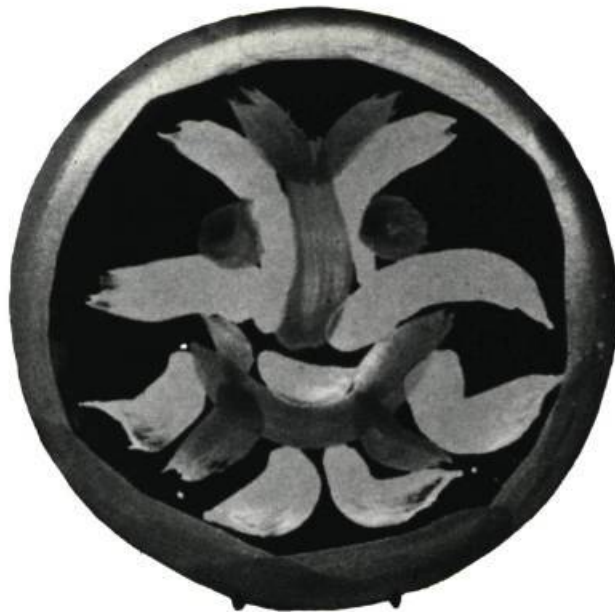
Ci-contre : Pablo PICASSO. Assiette. Céramique, 1963. Atelier Madoura, Vallauris.