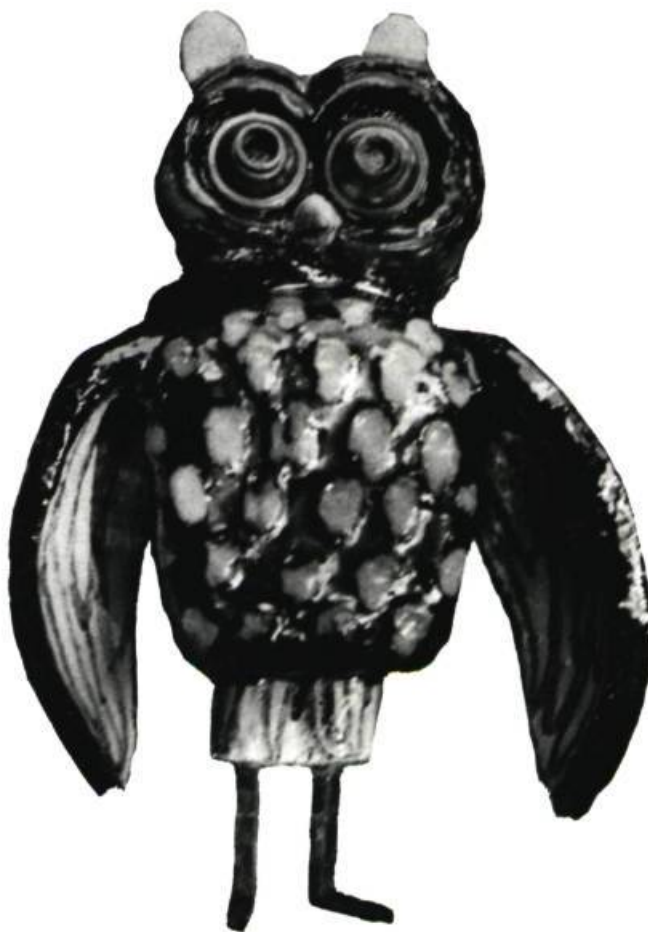
Ci-dessus : Guidette CARBONELL. Oiseau. Céramique. Hauteur : 11 \frac{3}{4} " (30 cm). Appartient à l'artiste.