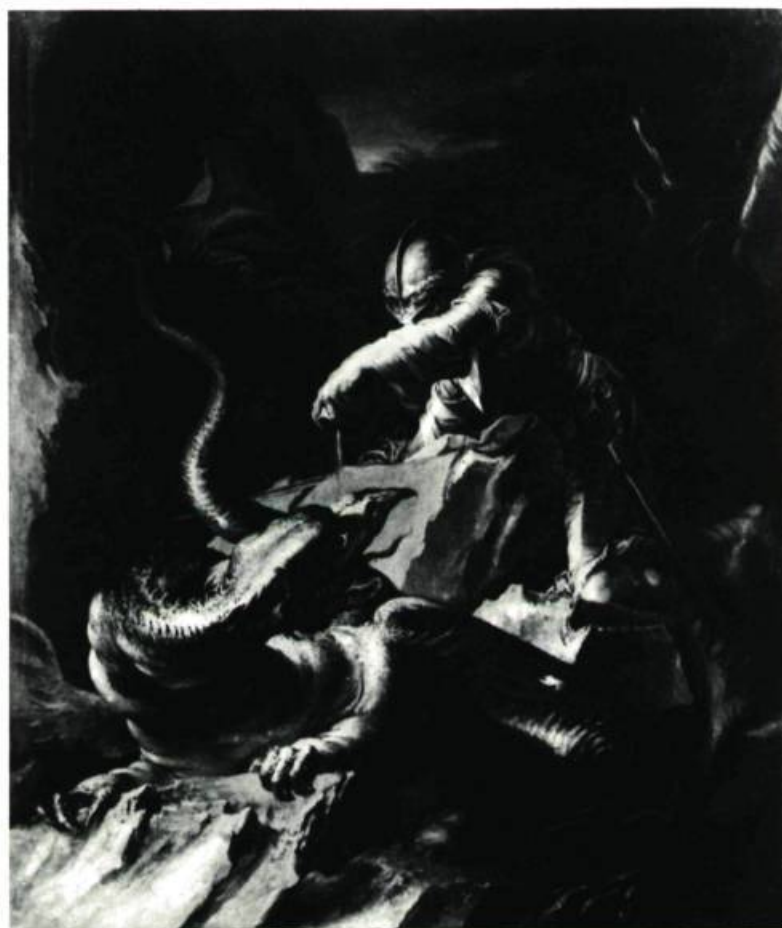
SALVATOR ROSA. Peintre italien. Naples-Rome, 1615-73. Jason charmant le dragon. Huile sur toile. 30 \frac{3}{4} " x 26" (77,10 x 66,25 cm.) Musée des Beaux-Arts de Montréal.

P REMIER MUSÉE DU CANADA en date et l'une des plus anciennes institutions du genre en Amérique du Nord, le Musée des Beaux-Arts de Montréal s'est efforcé d'établir un programme de manifestations qui marqueraient la centième année de son existence.