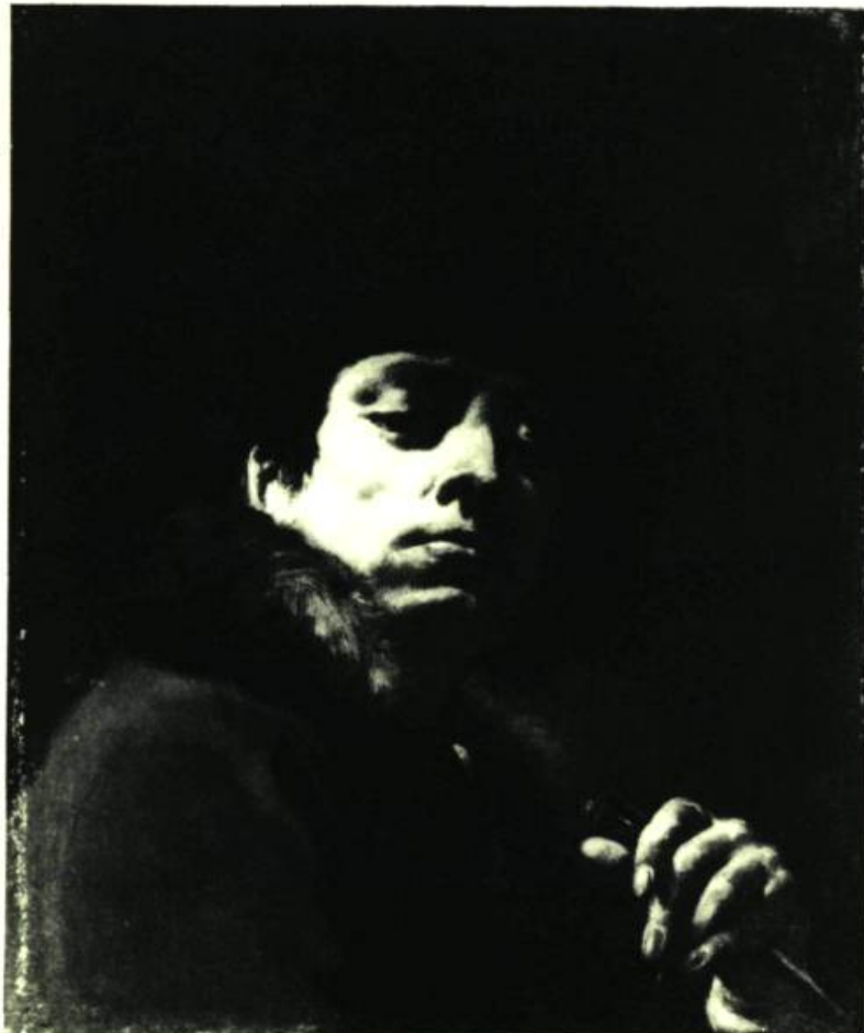
GIOVANNI BATTISTA PIAZZETTA. Peintre italien. Venise, 1682-1754. Portrait d'homme. (peut-être un autoportrait). Huile sur toile. 18½" x 15½" (47,15 x 39,50 cm.) Musée des Beaux-Arts de Montréal.