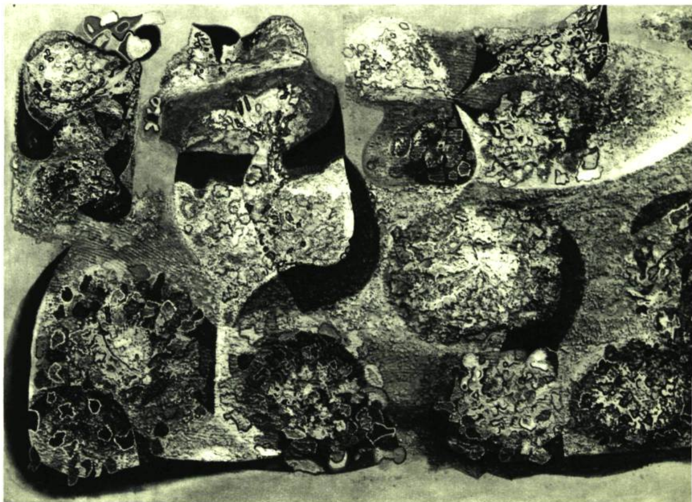
ALFRED PELLAN. Peintre canadien. Québec, 1906. Jardin volcanique. Huile sur toile. 41" x 73½" (104,45 x 187,25 cm.) Musée des Beaux-Arts de Montréal

L'achat d'une oeuvre moderne soulève toujours une vive discussion. Le choix en est souvent difficile, car pour apprécier maint style abstrait de nos jours, il faut beaucoup de temps et de réflexion, même aux experts. Pour la première fois, un certain nombre d'abstractions ont grossi la collection, notamment des oeuvres d'Afro (fig. 5), Soulages, Mathieu, Calder et Arp (fig. 8). En fait d'art moderne canadien, le comité féminin a donné au musée la plus récente oeuvre majeure de Pellan : le Jardin volcanique (fig. 7), et M. Gérard Lortie, l' Étoile noire de Borduas, dont on a pu admirer la reproduction dans le numéro d'été de Vie des Arts . Le musée désire encourager les jeunes artistes dans toute la mesure de ses moyens. Il a acheté des oeuvres de Bergeron, Ferron, Gendron, Mongeau, Roussil et Vaillancourt; et M. Gérard-O. Beaulieu lui a fait présent d'oeuvres récentes de Dumouchel, (fig. 6)