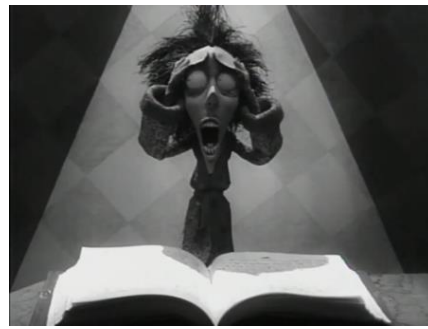
Vincent (Tim Burton, 1982)