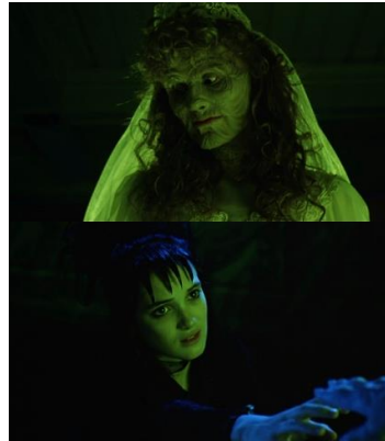
Beetlejuice (Tim Burton, 1988)

Cette expression de la vanité, et particulièrement celle de la vacuité des activités humaines, se marque fortement chez Burton par des décors vidés de toute présence, qui rappellent la prédominance du sentiment de solitude chez Edward Hopper ou David Hockney. La maison de Beetlejuice renvoie à la fois à celle de Psycho (Alfred Hitchcock, 1960), mais également à celle de House by the Railroad (Edward Hopper, 1925), maison typique de la Nouvelle-Angleterre. Plus généralement, qu'il s'agisse des manoirs gothiques d' Edward Scissorhands ou de Miss Peregrine's Home for Peculiar Children (2016), de la maison anciennement mitoyenne du père de Willy Wonka (Christopher Lee) dans Charlie and the Chocolate Factory (2005), devenue le dernier vestige d'une rue désormais déserte, ou encore de la ville abandonnée de Spectre dans Big Fish (2003), les lieux donnant l'impression d'être inoccupés abondent dans le cinéma burtonien. Dans Edward Scissorhands , la noirceur intérieure des individus est camouflée derrière des