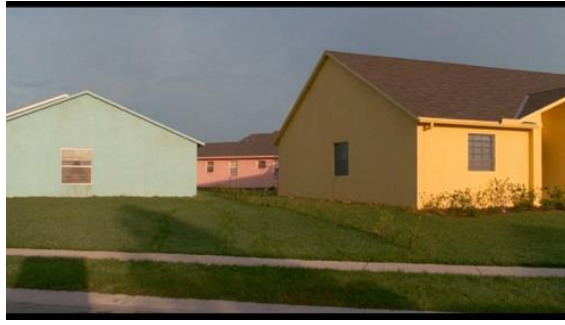
Edward Scissorhands (Tim Burton, 1990)

Dans Big Eyes , la majestueuse villa des Keane aux grandes baies vitrées, théâtre de jeux de réflexion et de lumière avec la piscine, rappelle les nombreuses peintures de piscine d'Hockney, particulièrement A Bigger Splash (1967). Jérôme Lauté compare l'esthétique de l'immense demeure de Big Eyes , à l'apparence inhabitée, avec l'œuvre de Richard Estes qui vide la société américaine de toute présence humaine et qui, par un travail sur les surfaces réfléchissantes, souligne la déshumanisation produite par la société occidentale : l'eau de la piscine des Keane refléchi sur les fenêtres de la villa est, en ce sens, une incarnation de la vanité 10 . Big Eyes , à lui seul, peut être considéré comme une citation de quasi deux heures, d'abord à travers les citations directes des peintures de l'artiste Margaret Keane (Amy Adams), mais également par le biais d'une tentative esthétique de se rapprocher de l'hyperréalisme des toiles de Richard Estes 11 — grâce à un travail sur les couleurs et la lumière.