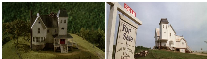
Beetlejuice (Tim Burton, 1988)

Les personnages burtoniens sont également souvent fabricants et manipulateurs de maquettes. À la fois outil d'élaboration de stratégie dans Pee-wee's Big Adventure ou dans The Nightmare Before Christmas , matérialisation d'un rêve dans Charlie and the Chocolate Factory ou encore mécanisme permettant l'ouverture d'un passage secret dans Batman Returns (1992), les maquettes, en tant qu'objets du décor et de la fiction, constituent de véritables mises en abîme en dévoilant la genèse de nombreux films burtoniens. Plus puissamment encore, Edward Scissorhands et Beetlejuice montrent les maquettes de leurs villes et manoirs respectifs avant de montrer leur matérialisation à grande échelle : le passage de la miniature au véritable décor rappelle le caractère artisanal et « fait main » de ce dernier 19 .