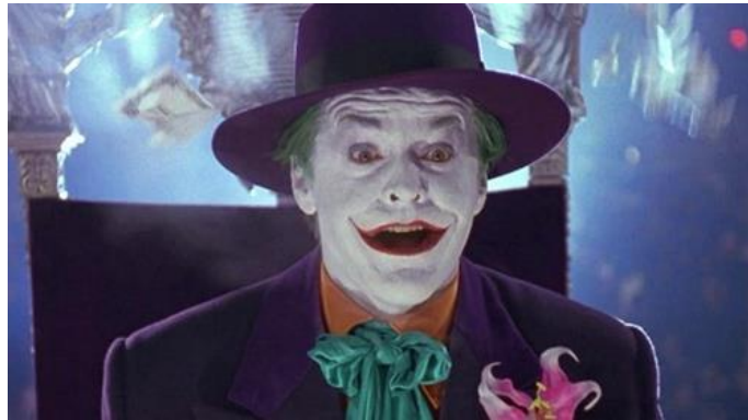
Batman (Tim Burton, 1989)

Ce contact tactile du Joker avec les œuvres exposées nous permet de donner une première interprétation à la place importante accordée à de nombreuses toiles peintes dans le cinéma burtonien. Si la référence à certaines d'entre elles permet de retranscrire une atmosphère particulière, émotion ou force symbolique qui leur sont inhérentes, la volonté de matérialisation en trois dimensions de sujets picturaux est prépondérante. Lors du tournage, les peintures prennent vie à travers des acteurs et actrices, des costumes réels et des décors palpables. Les œuvres picturales deviennent tangibles. L'interdit muséal se trouve bafoué : les peintures sont emparées à pleines mains par ces films.