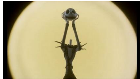
The Nightmare Before Christmas (Henry Selick, 1993)