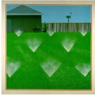
A Lawn Being Sprinkled (David Hockney, 1967)

habitations à l'aspect exagérément lisse, où l'herbe verte est toujours tondue et parfaitement arrosée. Cette « perfection » procure un effet d'absence de vie qui rappelle A Lawn Being Sprinkled (1967) de David Hockney : la peinture donne à voir l'arrosage automatique d'une pelouse, qui ne nécessite donc pas de présence humaine, mais également une haute palissade qui empêche de voir ce qui se passe chez le voisin, et qui, inversement, bloque la vie privée de regards curieux.