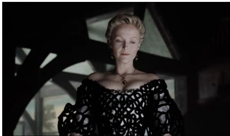
Sleepy Hollow (Tim Burton, 1999)