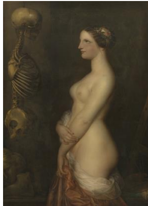
Deux jeunes filles ou La Belle Rosine (Antoine Wiertz, 1847)

Cette concrétisation matérielle d'une œuvre picturale célèbre se réitère dans Beetlejuice (1988). Marie-Camille Bouchindomme compare l'une des scènes finales du film, lors de laquelle le visage de Lydia (Winona Ryder) est confronté, par un champ-contrechamp, à celui d'un fantôme-cadavérique en décomposition, avec la peinture Deux jeunes filles ou La belle Rosine (1847) d'Antoine Wiertz 9 . La tonalité verdâtre du tableau est reproduite de façon plus abrupte dans le film par une violente lumière verte qui, d'un point de vue chromatique, opère une rencontre entre le cadavre et la jeune fille. Le contraste opéré entre la beauté de l'âge juvénile et la figure de la mort rappelle la précarité de l'existence humaine, éphémère.