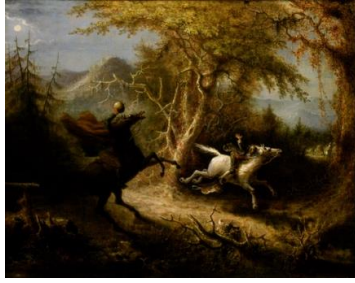
The Headless Horseman Pursuing Ichabod Crane (John Quidor, 1858)