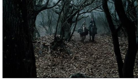
Sleepy Hollow (Tim Burton, 1999)

Le peintre américain John Quidor, puisant son inspiration dans l'œuvre de Washington Irving comme Burton pour ce film, est l'auteur de The Headless Horseman Pursuing Ichabod Crane (1858). Chez Burton comme chez Quidor, le paysage romantique — la nature sauvage baignée dans des effets de lumière presque irréels — se lie intimement au macabre. Une autre référence notable dans le film est la majestueuse robe ornée noire et blanche que porte Lady Van Tassel (Miranda Richardson), identique à celle du tableau Sidonia von Bork (1860) peint par Edward Burne-Jones. L'analogie de leurs vêtements renvoie à l'appartenance des deux personnages à la sorcellerie.