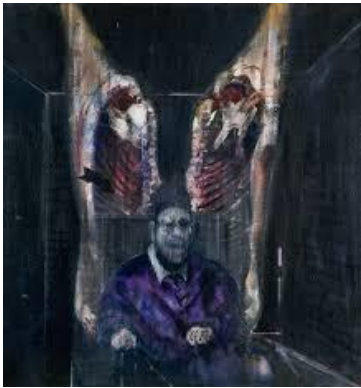
Figure with Meat (Francis Bacon, 1954)

voit dans le personnage représenté, visage déformé et costume violet, son reflet ? S'il semble incontestablement touché affectivement par le tableau, la séquence qui précède est extrêmement physique : le Joker transgresse la norme muséale suprême en touchant physiquement les œuvres. De ce fait, il oscille, par le contact physique avec l'art, entre création et destruction. Le public, quant à lui, devient le témoin, à la fois chanceux et tragique, d'une naissance et d'une mort artistique.