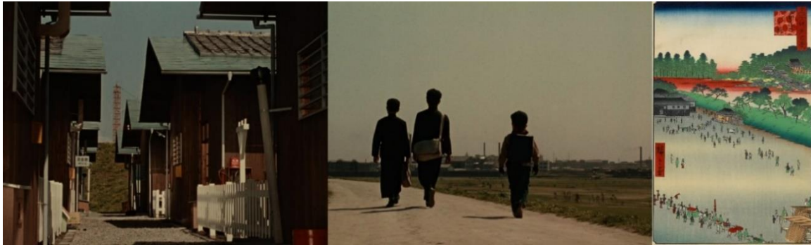
Bonjour et Cent vues d'Edo, vue n°9

n'est plus aussi boisé que l'Edo médiévale 27 . Ce qui importe donc, ce sont les rapports qu'entretiennent ces éléments dans les compositions, en termes de tailles, d'emplacements et de directions. Dans Bonjour (1959), le quartier résidentiel où se déroule l'action est le plus souvent introduit par des plans de la rue principale se prolongeant dans la profondeur de champ, jusqu'à une petite butte verdoyante. En haut se trouve la route que les enfants utilisent pour aller à l'école : elle est souvent montrée depuis un contrebas, donnant l'illusion que les personnages se déplacent dans un espace parfaitement naturel. Lorsque la caméra grimpe pour se mettre au niveau des enfants, on remarque qu'en effet le quartier se trouve dans un espace peu urbanisé, les autres bâtiments étant relégués sur la ligne d'horizon. Ici, ce n'est pas tant la vue paysagère que les plans de demi-ensemble et les arrière-plans qui installent le quartier dans un entre-deux à demi bucolique 28 .