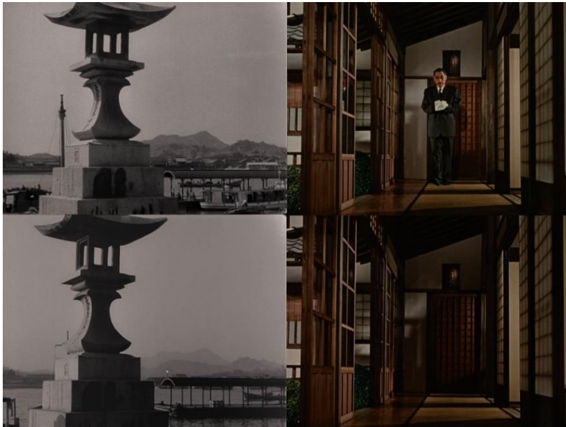
Voyage à Tokyo (à gauche) et Fin d'automne (à droite)