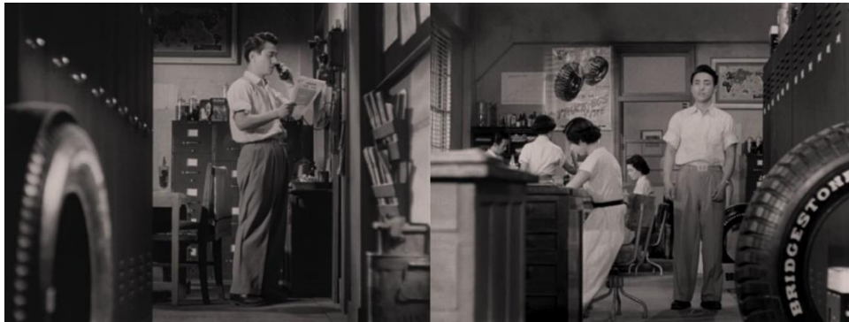
Voyage à Tokyo

Dans un deuxième temps, il s'agit de remarquer la récurrence avec laquelle les objets sont placés dans les premiers plans ozuiens. Cela peut être une bouteille qui s'invite au premier plan à la faveur d'un cadre accompagnant une sortie de personnage (Thomas, 2020, pp. 270-274), ou une suite de plans privilégiant les objets, parfois avec l'aide de la mise au point (Burch, 1982, p. 181). Mais Ozu insiste parfois sur la sensation d'un point de vue d'objet : dans Voyage à Tokyo , un employé appelle le personnage principal à venir répondre au téléphone, dans deux plans. Séparés d'un angle de 90°, le premier accueille un pneu à gauche de son avant-plan, pneu qui se retrouve à droite de l'avant-plan du second. Alors que le deuxième plan pourrait être une perception du personnage principal, le premier ne peut pas l'être, et c'est le pneu qui semble donner les plans à voir.