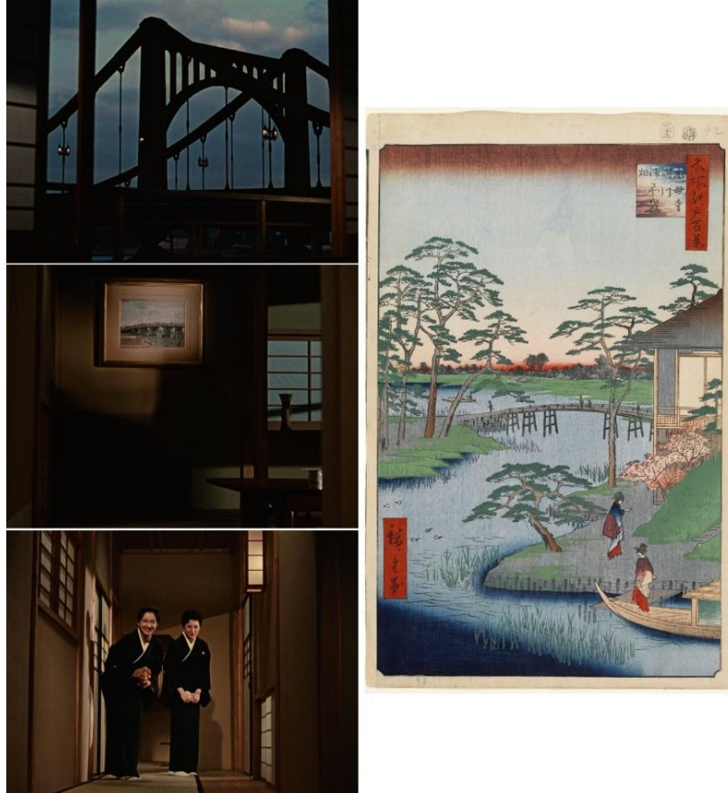
Fin d'automne et Cent vues d'Edo, vue n°92