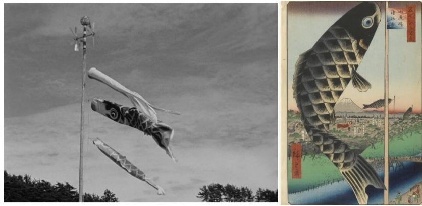
Été précoce et Cent vues d'Edo, n°48

Il convient alors de comparer un plan d' Été précoce avec la 48 e vue d'Edo : les deux représentent un drapeau en forme de carpe, caractéristique du kodomo no hi , la fête des garçons. Dans le film, un mat flanqué de trois carpes flottant vers la droite occupe le centre du plan, sur fond de ciel aux nuages fins. En bas, quelques pins tapissent discrètement l'amorce du cadre. Sur l'estampe, le drapeau-carpe emplît verticalement l'avant-plan, la tête en haut et la queue en bas. On devine, en bas, une allée et des personnages au bord de la rivière, à l'arrière, la ville et les étendards de cérémonie, au fond le mont Fuji, et le ciel comme fond de la moitié haute. La présence de ce motif dans deux œuvres séparées d'un siècle ne doit pas étonner puisqu'il est relatif à une fête traditionnelle. Cependant, c'est le cadrage et sa fonction qui nous intéressent. Dans un cas comme dans l'autre, le point d'observation est à hauteur de drapeau, vu frontalement, et il s'éloigne de la représentation de la fête pour en privilégier le symbole. Il se concentre sur l'expressivité mobile de cet objet plutôt que sur le mouvement humain.