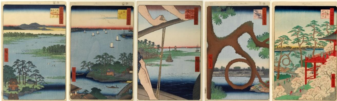
Cent vues d’Edo : n°87, 83, 72, 89 et 11