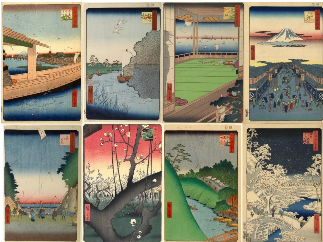
Cent vues d'Edo : de gauche à droite et de haut en bas, n° 39, 71, 82, 8, 2, 30, 47, 111

Enfin, le peintre utilise abondamment les éléments de poétisation traditionnelle que sont le mouvement du vent (2 e vue) ou la manifestation des saisons : fleurs (30 e vue), brume (41 e vue), pluie (47 e vue) ou neige (111 e et 112 e vues). Sans lui être exclusives, le cinéma des premiers temps a également élu ces formes, parce qu'elles lui permettaient de déployer son potentiel, la représentation réaliste et poétique du mouvement naturel (la « photogénie 16 » de Jean Epstein). Comme les commentateurs et commentatrices l'ont constaté, les intempéries sont omniprésentes chez A. Kurosawa (que l'on pense à Rashômon [1950] ou à Dersou Ouzala [1975]) mais quasiment absentes chez Ozu, qui poétise son univers avec des formes plus ordinaires et moins attendues.