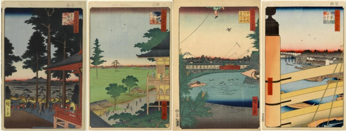
Cent vues d'Edo : n°18, 66, 3 et 43

paysage. Dans la 43 e , la vue est perçue depuis un pont dont la rampe imposante occupe l'avant-cadre, et sur lequel se trouve un personnage portant des seaux de poissons, que l'on peut voir en amorce. Chez Ozu, les cadrages semblables sont moins fréquents, mais on trouve des plans-passages (une catégorie de plan péridiégétique), qui insistent sur la présence des êtres et la persistance des choses. Fonctionnant souvent en paire, ils montrent un même lieu, habité ou déserté, selon une dialectique de la présence et de l'absence comparable à la posture hirosigienne.