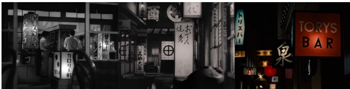
Le Goût du riz au thé vert, Voyage à Tokyo et Le Goût du saké

Les pancartes et autres enseignes sont légion dans les films d'Ozu. Dans Le Goût du riz au thé vert ou Voyage à Tokyo , certains plans péri-diégétiques multiplient ces formes rectangulaires qui forment des espaces plats et scripturaux qui s'extraient de la profondeur de champ, tandis que d'autres enseignes, en trois dimensions, y sont maintenues. Dans le dernier film du réalisateur, Le Goût du saké , le personnage principal découvre un bar et en devient rapidement l'habitué. Les trois séquences qui s'y déroulent jouent habilement de cette superposition d'enseignes colorées qui défient l'optique 38 . Or ces plans ont une potentialité d'image-monde, une autre catégorie de plans péri-diégétiques que nous différencions. Elle a pour caractéristique d'ouvrir vers l'univers filmique dans son ensemble, par le truchement d'un paysage naturel, mais aussi par les références aux autres films qu'elle introduit.