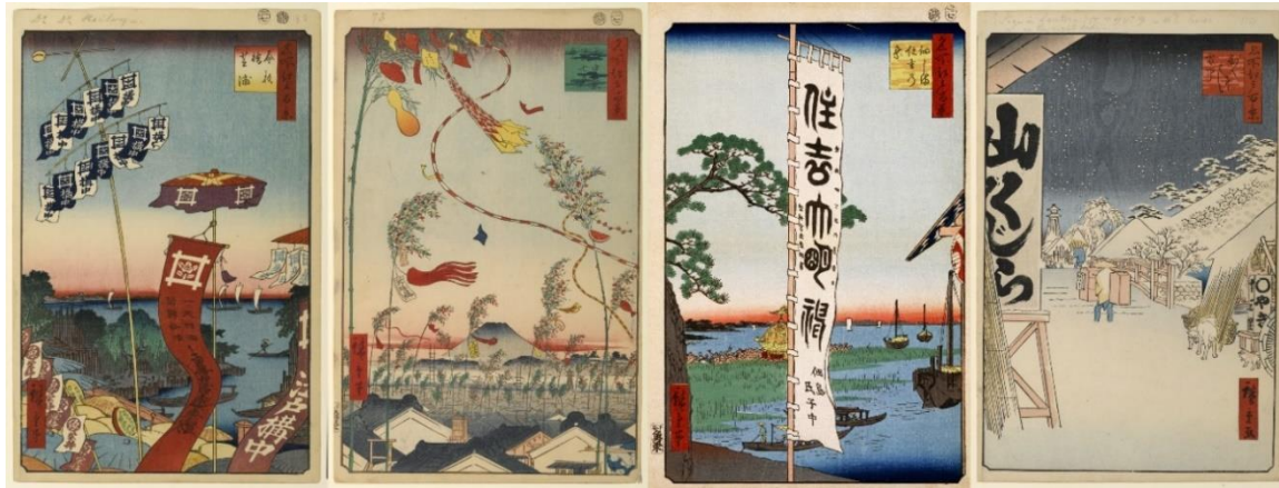
Cent vues d'Edo : n°80, 73, 55 et 114

vue dispose deux pancartes en amorce, une au premier plan à gauche, l'autre au deuxième plan à droite, entourée de petits chiens.