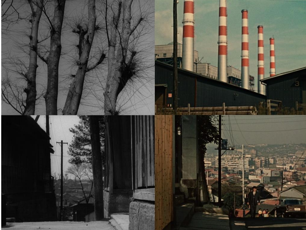
Crépuscule à Tokyo (à gauche), Le Goût du saké (à droite)

La naturalisation n'est donc pas le seul fait de la présence de végétation, ni de la comparaison d'éléments naturels et d'éléments urbains, mais d'un traitement comparable des deux pôles, les fondant en un seul et même environnement. Ce geste tend à rappeler que la ville peut être vivable si tant est qu'elle ne se limite pas à être un lieu, mais qu'elle s'envisage comme habitat naturel intégré au monde. Là où Hiroshige poétisait la ville par la représentation accrue de végétation, Ozu nous invite à considérer l'édifice humain comme aussi digne de regard que l'écorce, et à respecter l'arbre comme un monument naturel. Cela ne passe pas seulement par la coprésence répétée des deux règnes à l'écran, mais aussi par la façon dont les personnages en sont l'interface. Pris dans leur quotidien et leurs problèmes, les humains s'alignent côte à côte pour contempler le ciel ou la pierre ; tandis que les choses inertes semblent observer le mouvement de la vie.