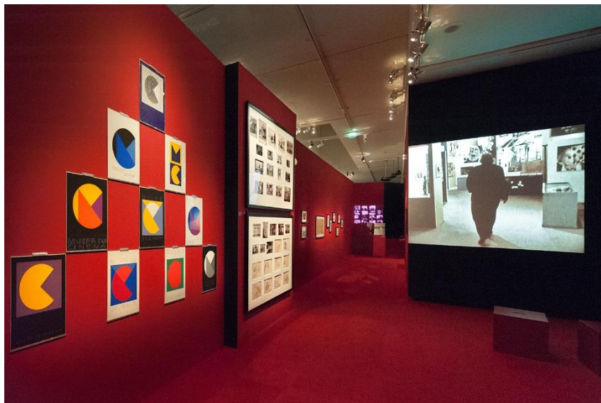
Logos commandés par Henri Langlois à Victor Vasarely pour son Musée du Cinéma présentés à l'exposition Le musée imaginaire d'Henri Langlois (2014)

Langlois ne cesse de tisser des liens entre peinture et cinéma en prêtant une attention particulière à l'illustration des affiches qui présentent ces événements. Elles sont souvent illustrées par des œuvres de ses amis peintres, comme Victor Vasarely à qui il empruntera un des projets de logo ( Ibid. , p. 324) commandé pour son Musée du Cinéma afin d'illustrer le programme, la couverture du carton d'invitation et l'affiche de la première exposition consacrée à Etienne-Jules Marey organisée en 1963 ; exposition pour laquelle Marcel Duchamp, Max Ernst ou encore Gino Severini prêtent des œuvres, illustrant ainsi les liens formels existants entre les travaux de l'inventeur et l'art moderne ( Ibid. , p. 327). En 1972, une œuvre de Fernand Léger orne l'affiche de l'exposition Trois quarts de siècle de cinéma mondial 11 , et inaugure l'ouverture de son Musée du Cinéma de Chaillot.