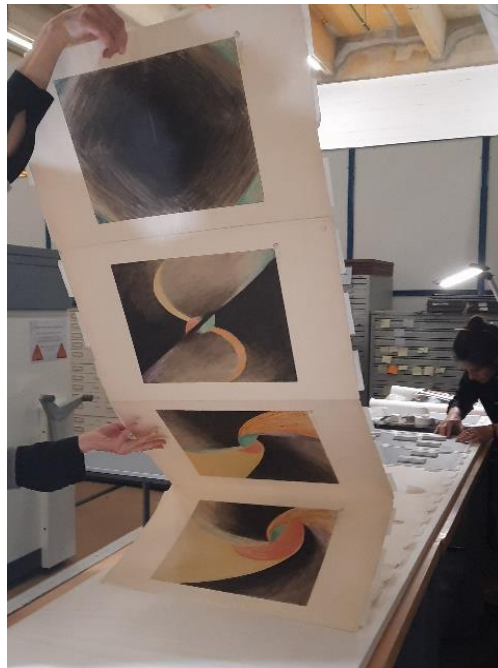
Œuvre démontée (photo du haut) et montage en volume (photo du bas) Rythmes colorés (Léopold Survage, 1913)

sein du parcours permanent du musée Passion Cinéma . Mondialement connue, elle fut empruntée par la Kunsthalle de Hamburg en 2009 lors de l'exposition Tanz der Farben organisée pour célébrer les cent ans des Ballets russes, où elle fut valorisée aux côtés des dessins de scénographies de Vaslaw Nijinsky et d'œuvres des peintres Sonia Delaunay et Frantisek Kupka. En 2024, imaginant un montage et un encadrement sécurisé laissant apparaître le volume de l'objet tel qu'il fut pensé par l'artiste sous forme de leporello , la Cinémathèque offre au public new-yorkais la possibilité d'avoir accès à une présentation de l'œuvre qui permet de la retrouver sous la forme de sa conception initiale.