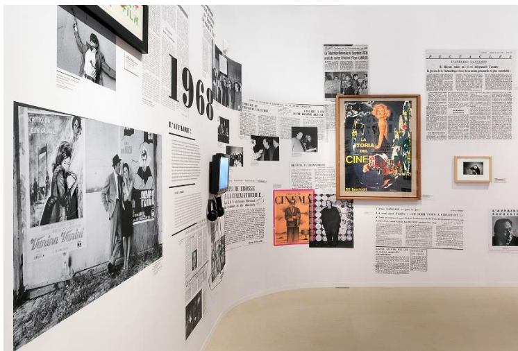
La storia del cinema de Mimmo Rotella dans l'exposition Le musée imaginaire d'Henri Langlois en 2014

Source d'inspiration thématique, le cinéma est aussi le vivier de nombreuses créations d'artistes contemporains. En 1995, la Cinémathèque fait l'acquisition de La Storia del Cinema de Mimmo Rotella datée de 1991 et numérotée 92/100. Signée par le peintre italien associé au courant artistique du « Nouveau réalisme », elle illustre la pratique du « double décollage » qui consiste à décoller une affiche exposée dans la rue, à la maroufler sur toile puis à la lacérer. Dans ce cas, Rotella puise dans l'imagerie liée au cinéma, réinvente une des photographies de Philippe Halsman, révélant ainsi tout comme Andy Warhol sa fascination pour le star system et pour une de ses plus grandes icônes : Marilyn Monroe.