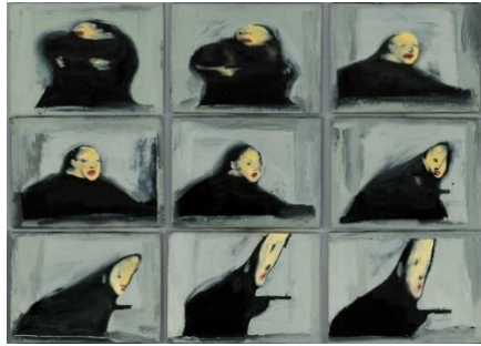
Séquence 1 - Présentation verticale