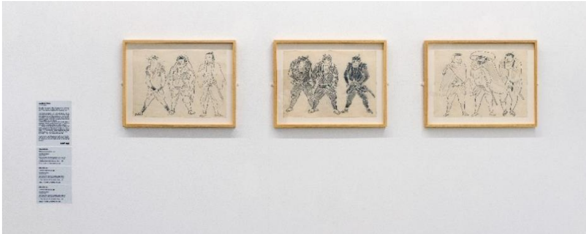
Photographie de l'exposition Tout un film ! , Cinémathèque française

constituent un rare témoignage du travail pictural en noir et blanc du début de carrière du réalisateur japonais pour son chef d'œuvre Les sept samourais (1954). Kurosawa représente à la mine de graphite les personnages très expressifs du film.