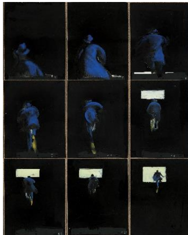
Séquence 2 – Présentation verticale