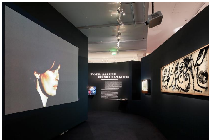
Pour saluer Henri Langlois de Pierre Alechinsky (1957) dans l'exposition Le musée imaginaire d'Henri Langlois (2014)