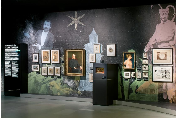
Musée Méliès exposition permanente de la Cinémathèque française