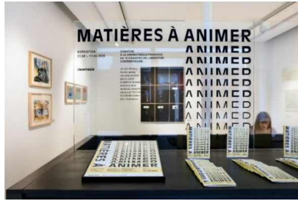
Exposition Matières à animer

Cinémathèque de favoriser les liens entre peinture et cinéma. Les engagements graphiques protéiformes des réalisateur·trice·s choisi·e·s pour cette donation nous ont permis de sélectionner des éléments issus de leurs processus créatifs autant pour leurs diversités techniques que pour leurs valeurs plastiques.