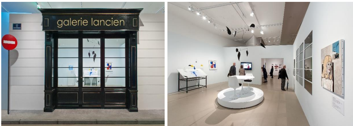
Photographies de l'exposition Le Monde enchanté de Jacques Demy