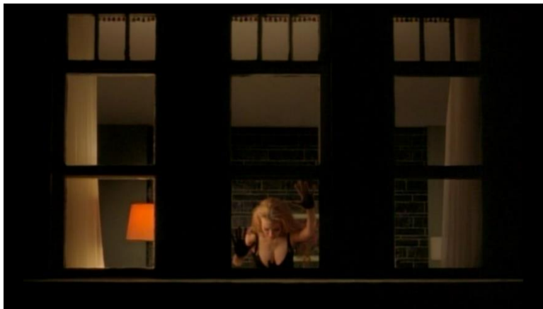
(Véra, enfermée dans l'appartement de Léopold, Gouttes d'eau , 2000, 1h18'15'')

Lorsque Franz meurt, Véra pleure à ses côtés et, une fois que Léopold, désintéressé, constate le décès, elle l'enveloppe entièrement dans son grand manteau, scellant le lien entre ces deux créatures impuissantes. Les derniers plans du film montrent Véra dans le salon, filmée de l'extérieur de l'appartement, essayant vainement d'ouvrir une fenêtre; une fois qu'elle comprend qu'elle n'y arrivera pas – on peut ainsi croire qu'elle ne pourra plus s'échapper à la cruauté de Léopold – elle demeure immobile tandis que nous entendons en son off « Traüme » (1970) interprétée par François Hardy, la chanson que Franz voulait écouter au début de l'acte. La théâtralité éclatée privilégiée par Ozon se manifeste une dernière fois à l'aide de ce très lent travelling arrière de la caméra. En nous éloignant du lieu du drame, il nous place de manière explicite dans la position de spectateur qui observe une actrice, en posture figée, attendant la fermeture du rideau ou le noir complet sur scène.