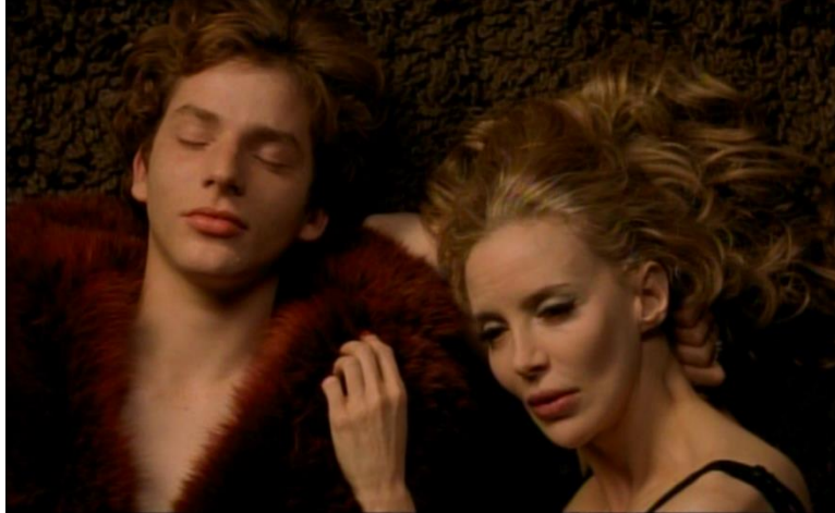
(Les deux créatures de Léopold, Gouttes d'eau , 2000, 1h10'01'')

Lorsque Franz meurt, Véra pleure à ses côtés et, une fois que Léopold, désintéressé, constate le décès, elle l'enveloppe entièrement dans son grand manteau, scellant le lien entre ces deux créatures impuissantes. Les derniers plans du film montrent Véra dans le salon, filmée de l'extérieur de l'appartement, essayant vainement d'ouvrir une fenêtre; une fois qu'elle comprend qu'elle n'y arrivera pas – on peut ainsi croire qu'elle ne pourra plus s'échapper à la cruauté de Léopold – elle demeure immobile tandis que nous entendons en son off « Traüme » (1970) interprétée par François Hardy, la chanson que Franz voulait écouter au début de l'acte. La théâtralité éclatée privilégiée par Ozon se manifeste une dernière fois à l'aide de ce très lent travelling arrière de la caméra. En nous éloignant du lieu du drame, il nous place de manière explicite dans la position de spectateur qui observe une actrice, en posture figée, attendant la fermeture du rideau ou le noir complet sur scène.