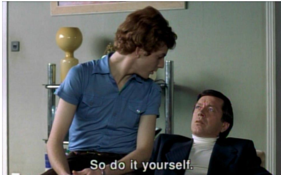
(Franz s'oppose à Léopold, Gouttes d'eau , 2000, 1h01'42'')

du fauteuil où Léopold est installé ; la tête de Franz est surélevée. Lorsqu'il s'oppose avec agressivité à la requête de Léopold, Franz s'incline vers lui et le regarde en plongée, ce qui illustre bien le changement (éphémère, il est vrai) dans les rapports de force entre les deux personnages. L'image brève est frappante : le visage de Léopold en plan rapproché continue d'afficher les sentiments de colère et d'agressivité, mais pour une des rares fois dans le film, Franz soutient son regard et maintient une position plus dominante pour mieux le confronter.