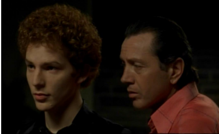
(La séduction de Franz, Gouttes d'eau , 2000, 11'34'')

abruptement et lui demande : « Vous avez déjà couché avec un homme ? » (11'34'') Cette scène, présentée sans didascalies dans la pièce, établit de manière éloquente comment le moment de séduction entre Léopold et Franz devient un rapport entre un prédateur et sa proie.