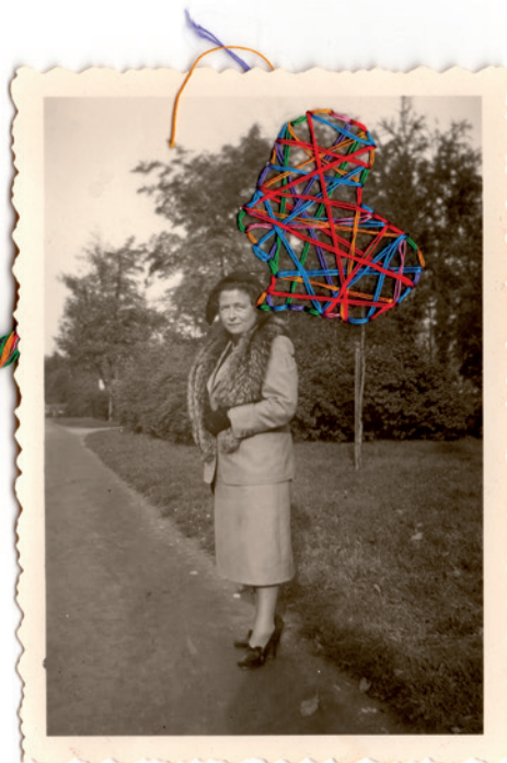
Tangled 1, 20 x 35 po, 2017.