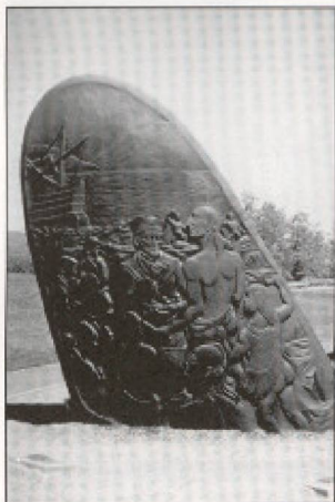
Rencontre entre Jacques Cartier et les autochtones : monument commémoratif.

Lieu historique national Cartier-Brébeuf 175, rue de l'Espinay, Case postale 2474 Terminus postal (Québec) G1K 7R3 Tél. : (418) 648-4038 Télec. : (418) 648-4825